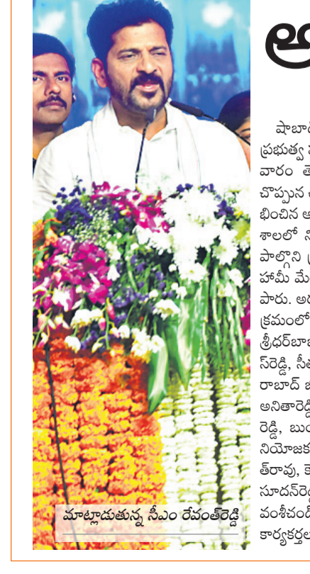
మాట్లాడుతున్న సీఎం రేవంత్ రెడ్డి