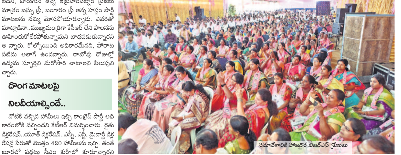
సమావేశానికి హాజరైన బీఆర్ఎస్ శ్రేణులు