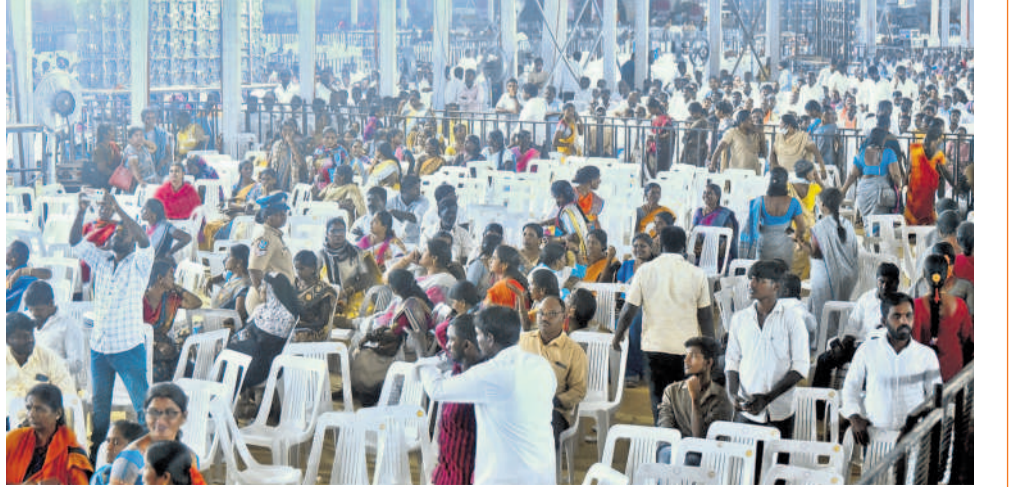
సభలో పాల్గొన్న జనం

చేపత్త కాంగ్రెస్ పార్టీ బహిరంగ సభలో సీఎం రేవంత్ రెడ్డి