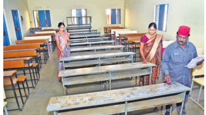
చేపత్త ప్రభుత్వ జూనియర్ కళాశాలలో నందిబద్ధ వేస్తున్న సిబ్బంది

13 హైదరాబాద్, బుధవారం 28 ఫిబ్రవరి 2024 | VIKARABAD