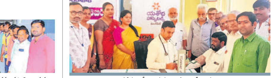
పరీక్షలు చేయించుకుంటున్న కాలనీ వాసులు

ఉంటాయని, విద్యార్థులు, సంబంధితశాఖ ఉద్యోగులకు మనహా ఇతరులకు పరీక్ష కేంద్రాల్లో అనుమతులుండవద్దన్నారు. చేష్టలూ: చేష్టలూ నాలుగు పరీక్షా కేంద్రాలను ఏర్పాటు చేశారు. ప్రభుత్వ జూనియర్ కళాశాల, ప్రభుత్వ మాడల్ జూనియర్ కళాశాల, వివేకానంద జూనియర్ కళాశాల, శ్రీ