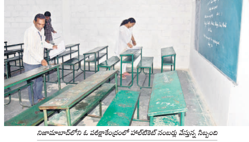
నిజామాబాద్ లోని ఓ పబ్లిక్ కాలేజీలో హాల్ టెలికెట్ నందుల్లో వేస్తున్న సిబ్బంది