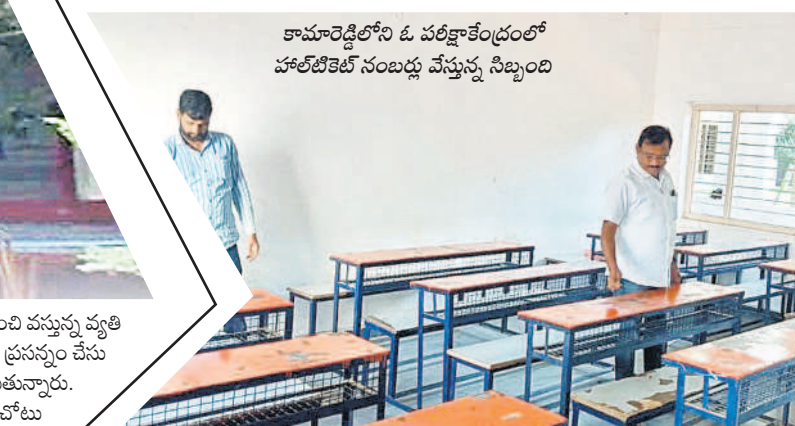
కామారెడ్డిలోని ఓ పబ్లిక్ కాలేజీలో హాల్ టెలికెట్ నందుల్లో వేస్తున్న సిబ్బంది