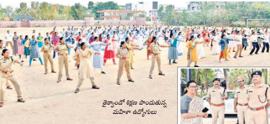
తైక్కాండో శిక్షణ పొందుతున్న మహిళా ఉద్యోగులు

కలెక్టర్ జితేష్ ఏ పాటిల్ కామారెడ్డి, ఫిబ్రవరి 27: రాబోయే పాఠ్య మెంటల్ ఎన్నికల సందర్భంగా డిటాబేస్ రూపొందించేందుకు ఉపాధ్యాయులు ఎపిక్ నంబర్లను అందించాలని కామారెడ్డి కలెక్టర్ జితేష్ ఏ పాటిల్ కోరారు. డి.జి.ఎం, ఎం.జి.ఎం, కాంప్లెక్స్ హెడ్ మాస్టర్లతో మంగళవారం నిర్వహించిన జామీ మీటింగ్ లో ఆయన మాట్లాడారు. ఓటరు డి.జి.ఎం నంబర్ ఇవ్వడంతో పోస్టల్ బాడ్జెట్ పేపర్ ముద్రణకు వీలుపొందన్నారు. పోస్టల్ లో అనుమతి లేకుండా ఉపాధ్యాయులు గ్రౌండ్ జర పుతున్నట్లు తమ దృష్టికి వచ్చిందని, ఇక నుంచి పోస్టల్ లకు తనిఖీ చేసేందుకు సీనియర్ అధికారులను నియమిస్తున్నట్లు తెలిపారు. ముందస్తు అనుమతి తీసుకోకే నెల పులు తీసుకోవాలని, అధికారుల తనిఖీలో ఉపాధ్యాయులు గ్రౌండ్ జరపిస్తున్న చర్యలు తీసుకుంటామని హెచ్చరించారు. పదో తరగతి పరీక్షలను సజావుగా జరిగేలా చూడాలన్నారు.