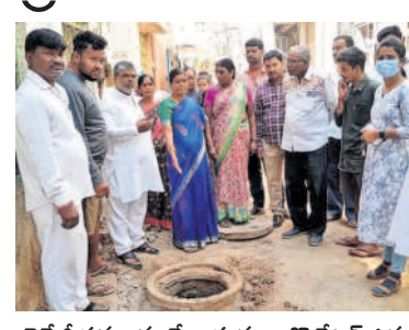
డైనేజీ పనులను చేయిస్తున్న కార్పొరేటర్ ఉమ

కవాడిగూడ, ఫిబ్రవరి 27: డివిజన్లో జరుగుతున్న డైనేజీ నిర్మాణ పనులను తఁరి తగతిన పూర్తి చేసి ప్రజల ఇబ్బందులను తొల గించాలని కవాడిగూడ కార్పొరేటర్ గోడ్చల రచ్యీ అధికారులను కోరారు. మంగళవారం డివిజన్లోని తాళ్లబస్తీలో నూతనంగా నిర్మి