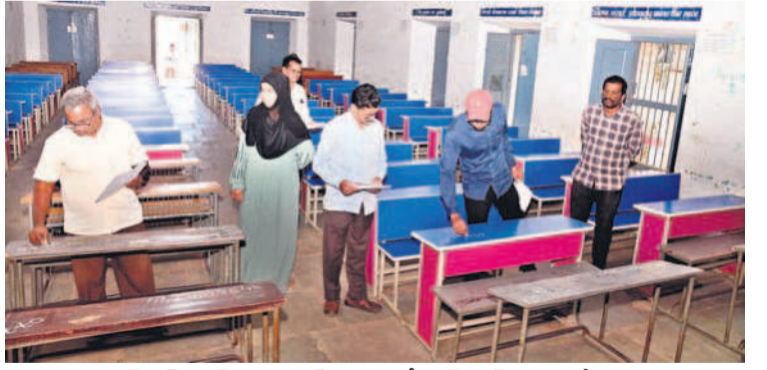
మహబూబ్ నగర్ బాయ్స్ జూనియర్ కళాశాలలో హాల్టింగ్ నెంబర్లు వేస్తున్న నిబ్బంది

2020లో దరఖాస్తు చేసుకున్న వారికే అవకాశం... ఉమ్మడి జిల్లాలో లక్ష మందికి ప్రయోజనం... మహబూబ్ నగర్ జిల్లా, ఫిబ్రవరి 27 : ఎల్ ఆర్ ఎస్ (లే ఆవుట్ రెగ్యులరైజేషన్ స్కీం) దరఖాస్తుదారులకు సంపూర్ణ శుభవార్త చెప్పింది. పుర ఆదాయాన్ని పెంచడమే లక్ష్యంగా ప్రభుత్వం 2020 ఎల్ ఆర్ ఎస్ కోసం దరఖాస్తు చేసిన వారు రెగ్యులరైజేషన్ చేసుకునేందుకు అవకాశం కల్పించింది. అప్పట్లో రూ.10లకు చెల్లించి దరఖాస్తు చేసుకోగా అప్పుడు నిర్ణయించిన ధర ప్రకారం చెల్లింపులు చేసినా ప్రభుత్వం ఆసమతిచ్చింది. మార్చి 31 లోగా దరఖాస్తు చేసుకున్న వాళ్ళకు తమ ఫోటోషేజ్ ను బట్టి ఫీజు చెల్లింపు రెగ్యులరైజేషన్ చేసుకోవాల్సి ఉంటుంది. మహబూబ్ నగర్ మున్సిపాలిటీలో 31,144 మంది దరఖాస్తు చేసుకోగా 659 పూర్తయి 2,075 దరఖాస్తులు బదిలీ చేశారు. మరో 29,069 దరఖాస్తులు పండింగ్లో ఉన్నాయి. భూత్యూర్లో 5,999 మంది దరఖాస్తు చేసుకోగా, 976 బదిలీ చేయగా, 5,029 పండింగ్లో ఉన్నాయి. జడ్పర్ల మున్సిపాలిటీలో 17,134 మందికి లబ్ధి చేకూరుస్తుంది. ఉమ్మడి జిల్లాలోని 19 మున్సిపాలిటీల్లో లక్ష మందికి ప్రయోజనం చేకూరుస్తుంది.