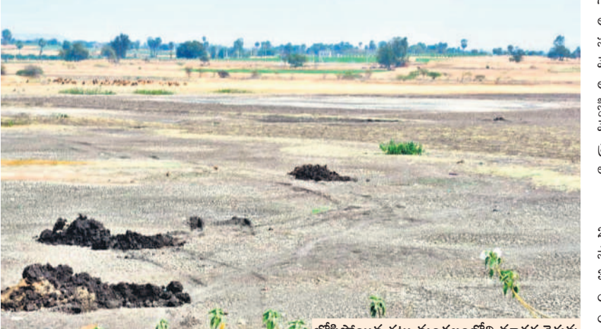
బోసిపోయిన గట్టు మండలంలోని మావల్ల చెరువు