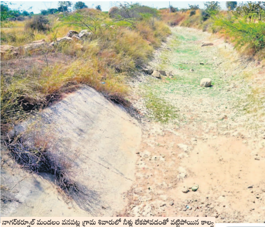
నాగర్ కర్నూల్ మండలం పనులపై గ్రామ శివారులో నీళ్లు లేకపోవడంతో వట్టిపోయిన కాల్వ