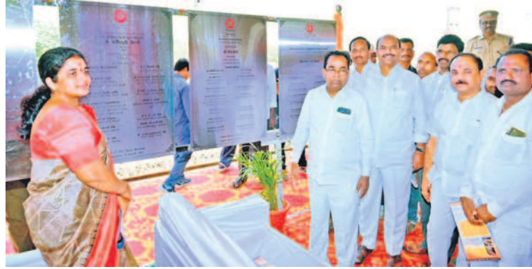
గద్వాల రైల్వేస్టేషన్ పునరాభివృద్ధి పనులను ప్రారంభిస్తున్న ఎంపీ, ఎమ్మెల్యే