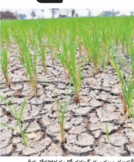
నీళ్లు లేకపోవడంతో ధర్మారం మండలం మాట్లబీడు శివారులో సెరైలుబాలన పరి పొలం

ఈ యాసంగిలో సాగు విస్తీర్ణం తగ్గడంతో సాగుపై నీలి నీడలు కమ్ముకున్నాయి. వానకాలంలో జూరాలకు వరదలు వచ్చిన సమయంలో అధికారులు రిజర్వాయర్లు, చెరువులు నింపి ఉంటే ఈ ఏడాది యాసంగి సాగు విస్తీర్ణం పెరిగింది. అధికారులు ఆలోచించిన నిర్ణయం వల్ల వచ్చిన వరదను వచ్చినట్లుగా దిగువకు విడుదల చేయడంతో ప్రస్తుతం రిజర్వాయర్లలో నీటి నిల్వలు నిండ