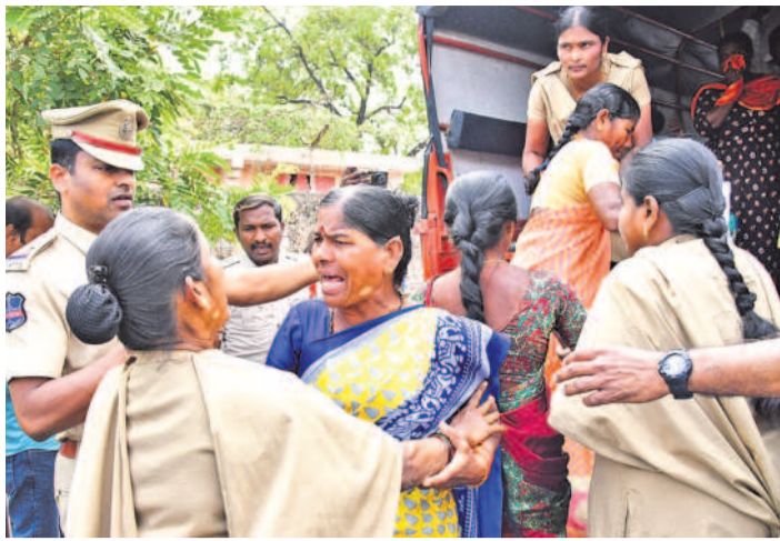
దళితబంధు మహిళా లబ్ధిదారులను బలవంతంగా వ్యాన్లోకి ఎక్కిస్తున్న పోలీసులు