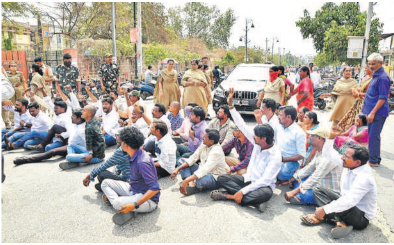
కరీంనగర్ కలెక్టరేట్ ఎదుట ఆందోళన చేస్తున్న దళితబంధు లబ్ధిదారులు