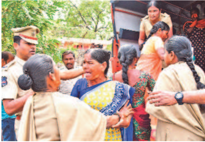
దళితబంధు మహిళా లబ్ధిదారులను బలవంతంగా వ్యాన్లోకి ఎక్కిస్తున్న పోలీసులు