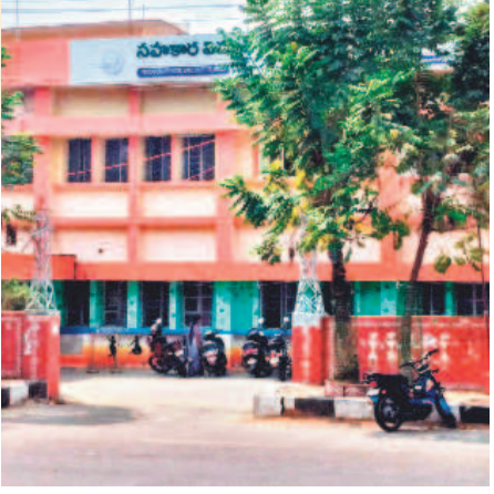
సీఎస్ టీ సహకార విద్యుత్ సరఫరా సంస్థ

రాజస్థాన్ సీఎస్ టీ, ఫిబ్రవరి 26 (నమస్తే తెలంగాణ): వినియోగదారులకు మెరుగైన సేవలు అందిస్తూ సహకార రంగానికి స్ఫూర్తిగా నిలిచిన సీఎస్ టీ సహకార విద్యుత్ సరఫరా సంస్థ (సెస్) ఇప్పుడు కష్టాలు సుడిలో చిక్కుకుని విలపిస్తున్నది. ఇప్పుడు కష్టాలు సుడిలో చిక్కుకుని విలపిస్తున్నది. ఇప్పుడు కష్టాలు సుడిలో చిక్కుకుని విలపిస్తున్నది. సెస్ ను నిలబెట్టుకుందామని పిలుపు