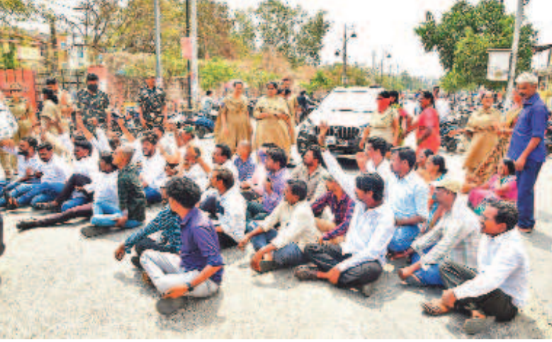
కరీంనగర్ కలెక్టరేట్ ఎదుట ఆందోళన చేస్తున్న దళితబంధు లబ్ధిదారులు