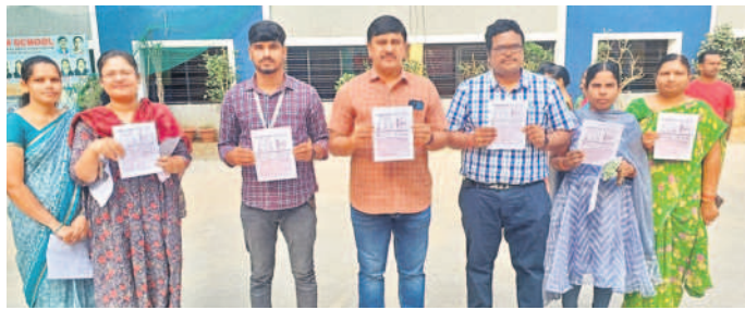
ఈ అభ్యాస ప్రశ్నాపత్రం విడుదల చేస్తున్న అకాడమీ ప్రతినిధులు