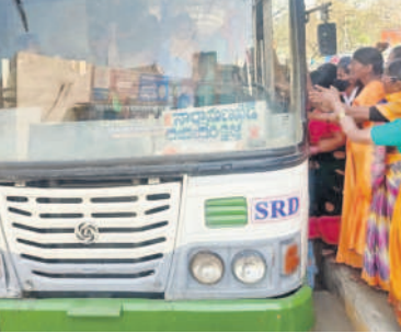
అల్లసలీ బస్సుకు ఎక్కే ప్రాంతం