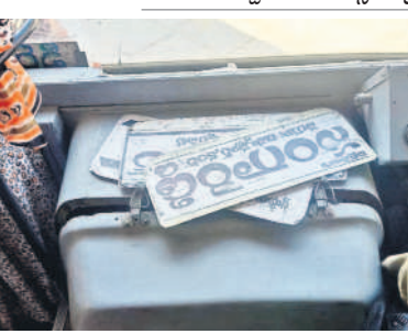
ఎక్కడైనా బస్సులో పట్టెలుగు బోర్డులు

అందోల్, ఫిబ్రవరి 25 : ప్రయాణికులే మన సంస్కృతి నిధి.. వారికి సేవచేయడమే మన విధి... ఈ బస్సు మనందరిది.. ప్రయాణికులు ఎక్కడ చెయ్యెత్తినా బస్సును ఆపాలి. ఇలా మనం ఆర్టీసీ బస్సుల్లో ప్రయాణించేటప్పుడూ అందులో మనకు కనీసం అక్షరాలు. ఇవ్వాలి గతం. కానీ ఇప్పుడు చెయ్యెత్తిన అక్షరం మాట దేవుడెవరు అడ్డం పడుతున్నా బస్సులు ఆపే పరిస్థితి లేదని జనాలు ఆరోపిస్తున్నారు. ఆర్టీసీ బస్సుల్లో ప్రయాణం.. సురక్షితంగా ఉండేదని కానీ ఇప్పుడు మాత్రం కిక్కిరిసిన జనంతో డ్రైవర్, కండక్టర్ ఈ సందిగ్ధాలతో కాలుపెట్టడానికి కూడా జాగ్రత్తేని విధంగా ప్రయాణం చేయాల్సి వస్తుందని ఆవేదన వ్యక్తం చేస్తున్నారు. కాంగ్రెస్ ప్రభుత్వం అధికారంలోని వచ్చాక మహిళల్ని పేరుతో మహిళలకు బస్సుల్లో ఉచిత ప్రయాణం కల్పించడంతో ప్రతి ఒక్కరికీ ప్రయాణంలో కష్టాలు మొదలయ్యాయి. బస్సుల్లో ప్రయాణించేటప్పుడు సంఖ్య పెరగడం, రద్దీకి తగినట్లుగా బస్సులు లేకపోవడం, పరిమితికి మించి ప్రయాణికులు వెళ్తున్నారు. దీంతో పలు ప్రమాదాలు జరుగగా.. నీట్కోసం మహిళలు అడ్డంకొని.. కొట్టు కొని రోజుంటూ ఉండడం లేదు. చాలా స్థానాల్లో