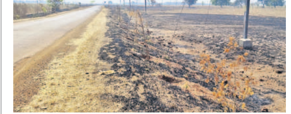
ఎల్వీయి గ్రామ శివారులో కాల్పోయిన హరితహారం మొక్కలు

రురూంగం, ఫిబ్రవరి 25 : బాటసారులు అంటించే నిప్పు కారణంగా హరితహారంలో నాటి చెట్లు కాలి బూడిదైపోయాయి. ఈ ఘటన మండల కేంద్రంలోని ఎల్వీయి గ్రామ శివారులో చోటు చేసుకుంది. కేసీఆర్ ప్రభుత్వం ప్రతిష్ఠాత్మకంగా చేపట్టిన హరితహారం పథకంలో భాగంగా నాటిన మొక్కలు ఎదిగిత వరకు సంరక్షించాలని అధికారులు పట్టించుకోవడం లేదు. రురూంగం నుంచి ఎల్వీయి వెళ్ళే మార్గంలో రోడ్డుకు ఇరువైపులా నాటిన మొక్కలకు కంటిలు లేని కారణంగా కొన్ని పనులకు మేతగానూ, మిగిలినవి బాటసారులు అంటించే నిప్పు కారణంగా కాలి బూడిదవుతున్నాయి. దీంతో ప్రజలందరినీ పూర్వపరణవేత్తలు అభిప్రాయపడుతున్నారు. ఉన్నతాధికారులు స్పందించి మొక్కలను కాపాడి పర్యావరణ సంరక్షణకు పాటుపడాలని స్థానికులు కోరుతున్నారు.