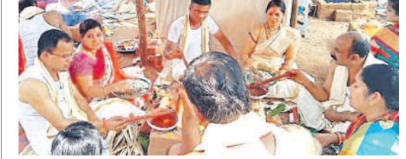
విశ్వేశ్వరాలయంలో హోమం చేస్తున్న భక్తులు

కోహిల్, ఫిబ్రవరి 25 : కోహిల్ (ఓంకార పట్టణం)లోని విశ్వేశ్వరాలయంలో దేవాలయార్చుల విగ్రహాల ప్రతిష్ఠాపన వైభవంగా నిర్వహించారు. ఆదివారం ఆలయ కమిటీ అధ్యక్షులతో శివలింగం, సందేశ్వరుడు, గణపతి, నాగదేవత, భద్రకాలి, వీరభద్రేశ్వరుడి విగ్రహాలకు పలు రకాల పూజలు చేశారు. అనంతరం ఆలయ ఆవరణలో మంగళహాయిద్యాలూ, వేదమంత్రోచారణలూ మధ్య హోమం నిర్వహించారు. నేడు ఆలయంలో వేదతామూర్తుల విగ్రహాలను ప్రతిష్ఠించనున్నారు. ఉత్సవాలను విజయ వంతం చేయాలని ఆలయ కమిటీ సభ్యులు కోరారు.