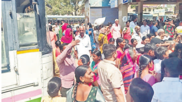
కోగపేట బస్సులో ఆర్టీసీ బస్సు ఎక్కేందుకు బారులు తీసిన ప్రయాణికులు

అందోల్, ఫిబ్రవరి 25 : ప్రయాణికులే మన సంస్కృతి నిధి.. వారికి సేవచేయడమే మన విధి... ఈ బస్సు మనందరిది.. ప్రయాణికులు ఎక్కడ చెయ్యెత్తినా బస్సును ఆపాలి. ఇలా మనం ఆర్టీసీ బస్సుల్లో ప్రయాణించేటప్పుడూ అందులో మనకు కనీసం అక్షరాలు. ఇవ్వాలి గతం. కానీ ఇప్పుడు చెయ్యెత్తిన అక్షరం మాట దేవుడెవరు అడ్డం పడుతున్నా బస్సులు ఆపే పరిస్థితి లేదని జనాలు ఆరోపిస్తున్నారు. ఆర్టీసీ బస్సుల్లో ప్రయాణం.. సురక్షితంగా ఉండేదని కానీ ఇప్పుడు మాత్రం కిక్కిరిసిన జనంతో డ్రైవర్, కండక్టర్ ఈ సందిగ్ధాలతో కాలుపెట్టడానికి కూడా జాగ్రత్తేని విధంగా ప్రయాణం చేయాల్సి వస్తుందని ఆవేదన వ్యక్తం చేస్తున్నారు. కాంగ్రెస్ ప్రభుత్వం అధికారంలోని వచ్చాక మహిళల్ని పేరుతో మహిళలకు బస్సుల్లో ఉచిత ప్రయాణం కల్పించడంతో ప్రతి ఒక్కరికీ ప్రయాణంలో కష్టాలు మొదలయ్యాయి. బస్సుల్లో ప్రయాణించేటప్పుడు సంఖ్య పెరగడం, రద్దీకి తగినట్లుగా బస్సులు లేకపోవడం, పరిమితికి మించి ప్రయాణికులు వెళ్తున్నారు. దీంతో పలు ప్రమాదాలు జరుగగా.. నీట్కోసం మహిళలు అడ్డంకొని.. కొట్టు కొని రోజుంటూ ఉండడం లేదు. చాలా స్థానాల్లో