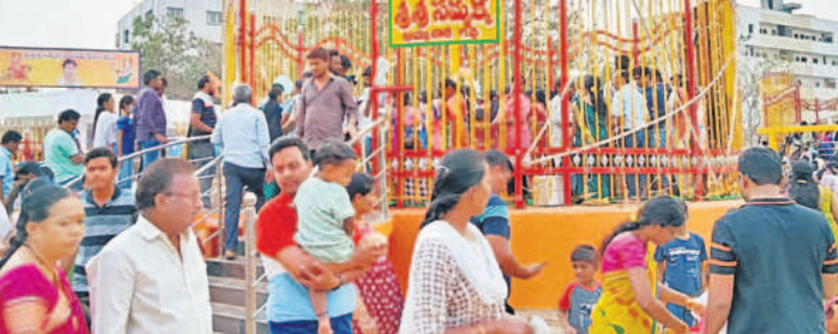
అమీన్పూర్లో సమ్మక్క గద్దె వద్ద మొక్కలు చెల్లించుకుంటున్న భక్తులు