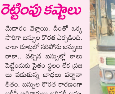
అల్లసలీ బస్సుకు ఎక్కే ప్రాంతం

మహిళల్ని పడకం అవుతుంటే ఏ బస్సు చూసినా మహిళలతో కిక్కిరిసిపోతున్నది. ప్రయాణికుల రద్దీకి అనుగుణంగా బస్సులు లేక ప్రజలు అవ్వలు పడుతుండగా మేడారం జాతర కోసం పెద్ద సంఖ్యలో బస్సులు వెళ్లడంతో ప్రయాణికులకు కష్టాలు రెట్టింపయ్యాయి. వారం రోజులుగా చాలా గ్రామాలకు బస్సు సర్వీసులు పూర్తిగా నిలిచిపోవడంతో పాటు ప్రధాన మార్గాల్లో సైతం బస్సుల సంఖ్య గణనీయంగా తగ్గింది. దీంతో వచ్చిన బస్సుల్లోనే లెక్కకు మించి ప్రయాణికులు ప్రయాణిస్తున్నారు. జిల్లాలోని మూడు ఆర్టీసీ డిపోల పరిధిలో 246 బస్సు సర్వీసులుండగా 124 బస్సులను మేడారం జాతర కోసం పంపించారు. ఇందులో అత్యధికంగా సంగారెడ్డి నుంచి 51 బస్సులు