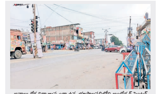
జనాలు లేక నిర్మాణస్థంగా ఉన్న భూపాలపల్లిలోని అంబేద్కర్ సెంటర్