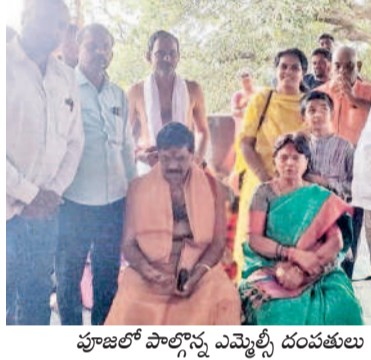
పూజలో పాల్గొన్న ఎమ్మెల్యే దంపతులు