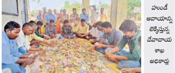
హుందీ ఆదాయాన్ని తెలియజేయ దేవదాయ శాఖ అధికారులు

భూపాలపల్లి రూరల్, ఫిబ్రవరి 25 : ఎన్నికల సమయంలో ప్రజలకిచ్చిన హామీలను ప్రభుత్వం నెరవేరుస్తుందని భూపాలపల్లి ఎమ్మెల్యే గండ్ర సత్యనారాయణరావు అన్నారు. ఆదివారం నియోజకవర్గ పరిధిలోని నాగార్, అజానంగల్, నందిగూడు, పంబాపూర్, దీక్షకుంట, దూడకులపల్లి, గొల్లమిద్దారం, రాంపూర్, కమలాపూర్, కొంపెల్లి, గొల్లపేడు, వజనపల్లిలో రూ. 1.65 కోట్లతో చేపట్టనున్న సీసీ రోడ్ల పనులకు ఆయన శంకుస్థాపన చేశారు. అనంతరం అజానంగల్ ప్రభుత్వ ఉన్నత పాఠశాలలో రూ. 13.50 లక్షల నిధులతో నిర్మించనున్న సైన్స్ ల్యాబ్కు శంకుస్థాపన చేశారు. ఈ సందర్భంగా ఎమ్మెల్యే మాట్లాడుతూ ప్రభుత్వం ఇప్పటికే కొన్ని హామీలను అమలు పరిచిందన్నారు. గృహజ్యోతి, వంటగ్యాస్ పథకాల అమలుకు త్వరలో నిర్ణయం తీసుకుంటామని, ఇండ్ల లేని ప్రతి కుటుంబానికి రూ. 5 లక్షల అందజేస్తామని తెలిపారు. అన్ని గ్రామాల అభివృద్ధి ప్రభుత్వం ధ్యేయమని, డ్యాక్రా మహిళలకు అందజేసిన కుటుంబసృష్టి ఆర్థికంగా ఎడమగాలిని ఎమ్మెల్యే సూచించారు. కార్యక్రమంలో ప్రజా ప్రతినిధులు, కాంగ్రెస్ నాయకులు, అధికారులు, కార్యకర్తలు పాల్గొన్నారు.