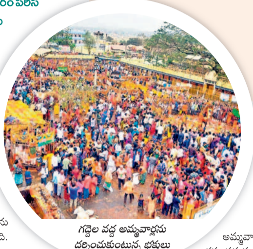
గద్దెల వద్ద అమ్మవార్లను దర్శించుకుంటున్న భక్తులు

భక్తులతో పాటు వివిధ రకాల వ్యాపారులతో నాలుగు రోజుల పాటు సందడిగా మారిన జాతర పరిసరాలు నిశ్శబ్దంగా మారుతూ మేడారం పాత రూపును సంతరించుకుంటున్నది.