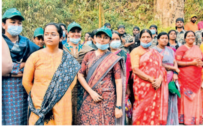
జాతరలో భాగంగా బిలుకలగుట్ట వద్ద సమృద్ధి రాక కోసం ఎదురుచూస్తున్న మహిళా అధికారులు, ప్రజాప్రతినిధులు (ఫైల్)

ములుగు, ఫిబ్రవరి 25 (నమస్తే తెలంగాణ) : మేడారం సమృద్ధి-సారలమ్మల సూర్యతో 2024 జాతరను విజయవంతం చేయడంలో మహిళా అధికారులు, ప్రజాప్రతినిధులు తమ మార్గం చాటుకున్నారు. పోరాట సూర్యకి చిహ్నమైన వీరవనీతల జాతరలో 90 శాతం మంది మహిళలు నిర్వహణాధికారులుగా విధులు నిర్వహించి భక్తులకు సేవలు అందించారు. భారత ఏర్పాట్లను మొత్తం తన భూభాషలనే వేసుకొని ప్రతి రోజూ స్వయంగా సమీక్షించిన రాష్ట్ర పంచాయతీరాజ్, గ్రామ