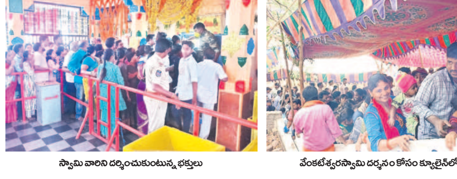
స్వామి వారిని దర్శించుకుంటున్న భక్తులు