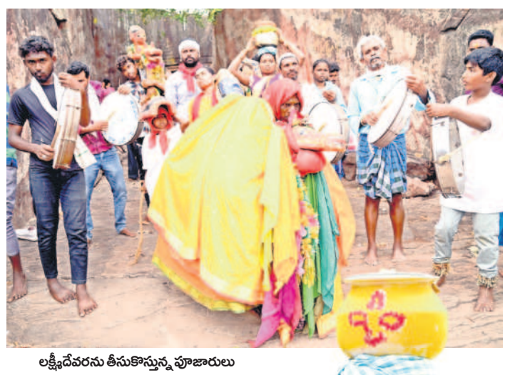
లక్ష్మీదేవరను తీసుకొస్తున్న పూజారులు