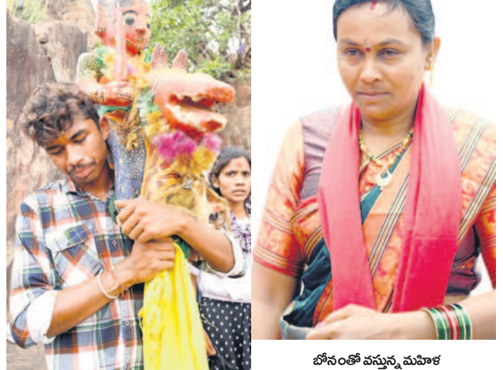
బోనంతో వస్తున్న మహిళ