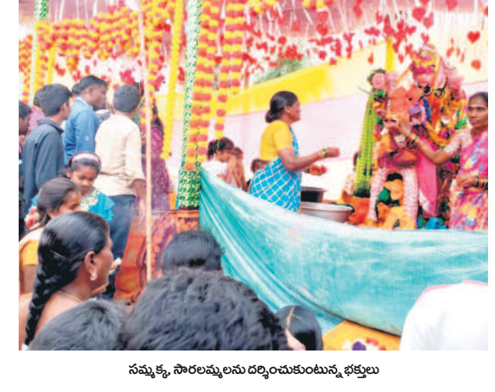
సమ్మక్క, సారలమ్మలను దర్శించుకుంటున్న భక్తులు

కన్నెపల్లి, ఫిబ్రవరి 25 : మండలంలోని గొట్ట గ్రామ శివారులో కొలువైన సమ్మక్క-సారలమ్మలను ఆదివారం భక్తులు దర్శించు కున్నారు. బెల్లం, మేతలు, కోళ్లను సమర్పించి మొక్కులు తీర్చుకున్నారు. కోరికలు నెరవేరాలని అమ్మవార్లను వేడుకున్నారు.