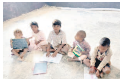
పాలశాలలో చదువుతున్న కొలాం పిల్లలు

న్నారు. ఊరు మీద ముసుకారం ఉన్నా, వేధింపులు తాళలేక వెళ్లక తప్పని పరిస్థితులు వస్తున్నాయని గిరిజనులు ఆవేదన వ్యక్తం చేస్తున్నారు.