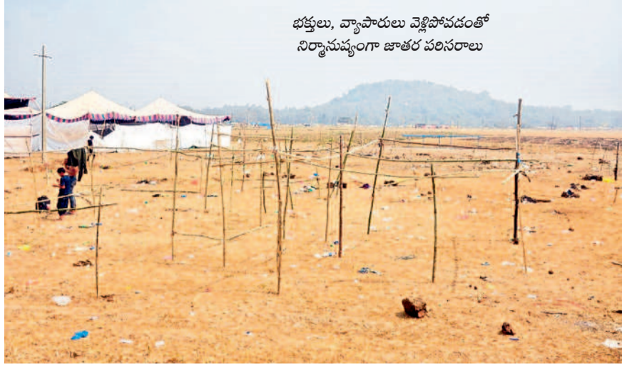
భక్తులు, వ్యాపారులు వెళ్ళిపోవడంతో నిర్మాణస్థంగా జాతర పరిసరాలు