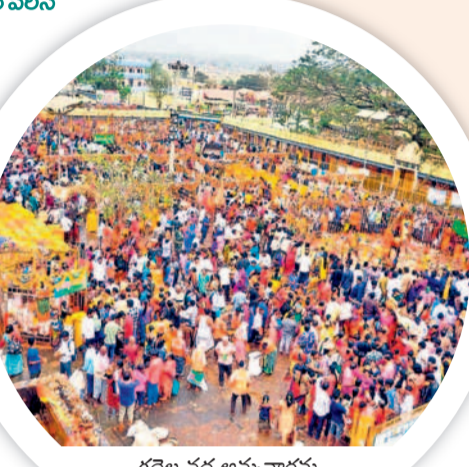
గద్దెల వద్ద అమ్మవార్లను దర్శించుకుంటున్న భక్తులు

ఆదివారం సెలవుదినం కావడంతో భారీగా జనం తరలివచ్చారు. జంపన్నవూగులో పుణ్య స్నానాలు ఆరంభించి అమ్మవార్లను దర్శించుకున్నారని గిరిజన సంప్రదాయ పద్ధతుల్లో