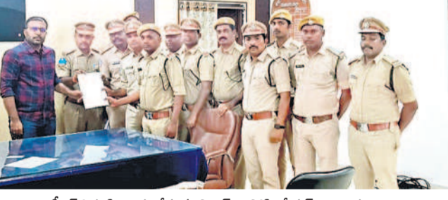
డిఎఫ్డెల ఫిర్యాదు చేస్తున్న ఫార్మెస్ అసోసియేషన్ అధికారులు

పాత్రీని అధికారుల సంఘం ములుగు రూరల్, ఫిబ్రవరి 25 : మేడారంలో తన భార్యను దైవ దర్శనానికి తీసుకువచ్చిన ఎలర్ ఎస్సెపై రచించిన అపవిత్ర అధికారి కౌటూర్ శామ్మ తీవ్రంగా ఖండిస్తున్నామని వరంగల్ పోలీస్ అధికారుల సంఘం నాయకులు ఆదివారం సోషల్ మీడియా వేదికగా ఆడియా పోస్టు చేశారు. పోలీస్ శాఖలో చాలా మంది మంది అపవిత్ర అధికారులు ఉంటారని, ఎవరూ పోలీసులైనా ప్రవృత్తిపరమైనది తెలిపారు. విధుల్లో ఉన్న ఎలర్ ఎస్సెపై చేయిచేసుకోవడం సరికాదన్నారు. ఎస్సెపై నుంచి ఎస్సెల వరకు వారి కుటుంబసభ్యులను కానిస్టేబుళ్లు, గన్ మెన్లు, డ్రైవర్ల దగ్గరండి దర్శనాలకు తీసుకెళ్లారని, దూర్బలో ఉన్న ఎలర్ ఎస్సెపై తన భార్యను దర్శనానికి తీసుకెళ్లడం తప్పా? అని ప్రశ్నించారు. అతడి కుటుంబసభ్యుల ముందు కొట్టడం ఎంత వరకు సమంజసమని ప్రశ్నించారు. ఎస్సెపై చర్యలు తీసుకొని ఇలాంటి మరోసారి జరగకుండా అధికారులు చూడాలని కోరారు.