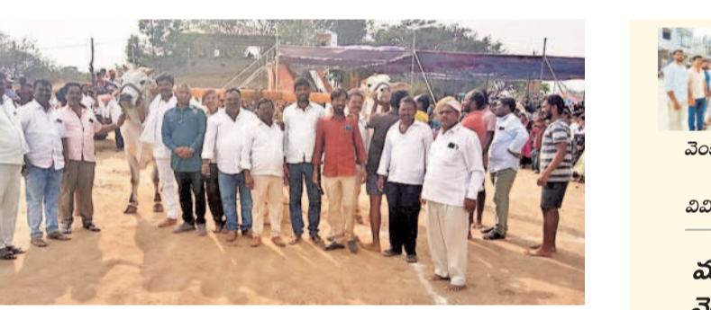
ఎడ్ల పందేలో పాల్గొన్న నిర్వాహకులు, భక్తులు