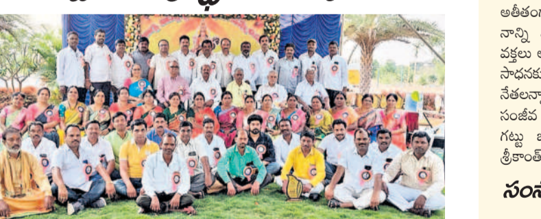
అలనాటి ఉపాధ్యాయులతో పాటు విద్యార్థులు

కందుకూరు, ఫిబ్రవరి 25: కందుకూరు జిల్లా హైస్కూల్ పూర్వ విద్యార్థులు ఒక వేడుకగా వారి సమ్మేళనాన్ని ఆదివారం ఘనంగా జరుపుకున్నారు. కందుకూరు జిల్లా పరిషత్ ప్రభుత్వ పాఠశాలలో 1994 - 1995 వ.విద్యా సంవత్సరంలో 10వ తరగతి చదువుతున్న విద్యార్థులు పాఠశాలలో సమావేశం అయ్యారు. అలనాటి ఉపాధ్యాయులను ఆహ్వానించి సన్మానించారు. అలనాటి జ్ఞాపకాలను నెమరుచేసుకు