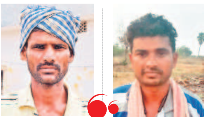
బదేండ్ల సంది ఎప్పుడు ఇట్లా చూడలే

నీళ్లు ఇడిసిపట్టలేదు.. సేను ఎండిపోయింది మాకు మూడెకరాల వ్యవసాయం ఉన్నది. ఇండ్ల ఎకరంపై వరి సేనుపెట్టిన. ఎండకాలం నీళ్లు ఎల్లులు అని ముందుగానే అనుకుని సగమే పెట్టినం. దీనికే రూ. 30 వేలదాకా పెట్టుబడి పెట్టిన. పోయినసారి కూడా వరి ఎండి పోయేటట్లు ఉండే. ఆర పల్లి సెరువులకు నీళ్లు ఇడిసిపెట్టేది. ఈసారి నీళ్లు ఇడిసిపెట్టలేదు. మా సేను అంతా ఎండిపోయింది. మడి ఎనుక మడి ఎందుకుంటుపోయింది. రోజుకు గంట నీళ్లు ఎల్లు తున్నాయి. నక్కగ పొలం పారుతలేదు. పల్లెచెరువులకు నీళ్లు ఇడిసిపెడుతారు.. బాయిలు ఉబ్బుతున్నాయి.