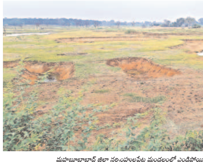
మహబూబాబాద్ జిల్లా నల్లంపల్లెపేట మండలంలో ఎండిపోయిన పెద్దనాగారు చెరువు

భూగర్భ జలాలు పడిపోతుండడంతో నిన్నుమొన్నటి వరకు నిండగా పోసిన బోరుబావులు ఇప్పుడు మొరాయిస్తున్నాయి. పదుల సంఖ్యలో, వందల ఫీట్లలో బోర్లు వేయడం, నీటి ఊటలేక అవి ఎందుకూ కొరగాకుండా పోవడం పరిపాలనా చూరింది. అర ఎకరా, ఎకరా సాగుచేయడమే గగనంగా మారింది. గత ప్రభుత్వం క్రమంగా చెరువులను నింపడం ద్వారా 30 లక్షల బోర్లు కింద దాదాపు 45 లక్షల ఎకరాలకు ఎలాంటి ఇబ్బంది లేకుండా సాగునీరు అందింది. ప్రస్తుతం ఆ ఆయకట్టు పరిస్థితి ప్రస్తావనగా మారింది. అందులో సగం కూడా పండని దుస్థితి క్షేత్రస్థాయిలో నెలకొనడంతో రైతులు దిక్కుతోచని స్థితిలో పడిపోయారు. చేతికొచ్చిన పంటను కాపాడుకునేందుకు రైతులు నానా తంటాలు పడుతున్నారు.