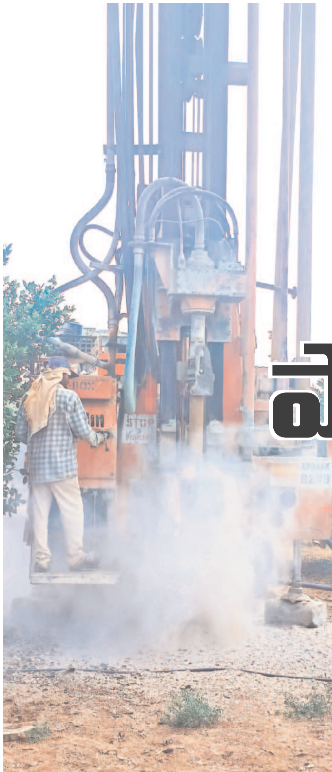
450 ఫీట్ల బోర్ వేసినా నీళ్లు పడుతలేవు

గతంలో ఎన్నీ కార్పొరేషన్ నోల్ మంజూరైన కనాం భూమి 1.10 ఎకరాల్లో వేసిన బజ్జాయి తోట పెట్టిన. అప్పుడు వేసిన బోరు ఇప్పుడు పట్టిపోయింది. నీళ్లు లేక చెట్లు ఎండిపోయే పరిస్థితి దాపురించింది. ఇన్వెంట్లలో ఇంతగా సాగు నీటి ఇబ్బందులు ఎప్పుడూ చూడలేదు. చెట్లను కాపాడు కోవాలని తోటలో ఇంకో బోరు వేయవచ్చు. మా ఊళ్లో 450 ఫీట్ల బోరు వేయించినా నీటి జాడ దొరుకుతలేదు. ఇంక బియ్యం పెట్టి బోరు వేస్తున్నా నీళ్లు పడుతాయనే నమ్మకం లేదు. తోటను దేవుడి కాపాడాలి.