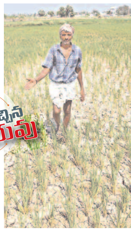
నల్లగొండ మండలం వెలుగుపల్లిలో నీళ్లు లేక నెర్రెలు బాలన పొలాన్ని చూపుతున్న రైతు

భూగర్భ జలమట్టం 6.8 నుంచి 7.72 మీ.కు మరింత భయంకరంగా కృష్ణా బేసిన్ పరిస్థితి ఆశించిన స్థాయిలోనే ప్రాజెక్టుల నీటివిడుదల గతంలోలాగా చెరువులను నింపని సర్కారు మున్ముందు మరింత దారుణ పరిస్థితులు