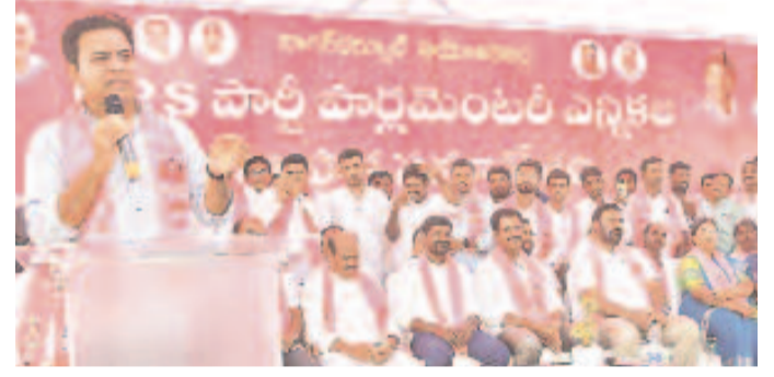
నాగర్ కర్నూల్ నియోజకవర్గ బీఆర్ఎస్ పార్లమెంటుల ఎన్నికల సన్నాహక సమావేశంలో మాట్లాడుతున్న పార్టీ పబ్లింగ్ ప్రెసిడెంట్ కేటీఆర్