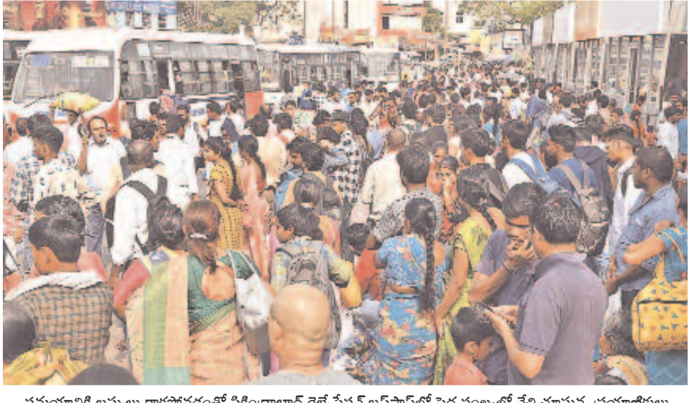
సమయానికి బస్సులు రాకపోవడంతో సికింద్రాబాద్ రైల్వేస్టేషన్ బస్స్టాండ్ లో పెద్ద సంఖ్యలో వేచి చూస్తున్న ప్రయాణికులు

టెస్ట్ జోన్ ఎంపికను మార్చలేం నేటి నుంచి ఎప్సెట్ దరఖాస్తుల స్వీకరణ >10 బడి సంచి బరువు 30% తగ్గింపు 90 నుంచి 70 జీఎస్ఎంకు పేపర్ మందం కుదింపు వచ్చే విద్యాసంవత్సరానికి 1.90 కోట్ల ఉచిత పుస్తకాలు ఏప్రిల్ చివరికల్లా జిల్లాలకు చేర్చేలా ప్రణాళికలు >10