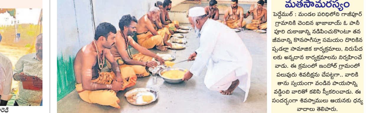
మతసామరస్యం పెద్దేమర్ : మండల పరిధిలోని గాజీపూర్ గ్రామానికి చెందిన భాజాబాయ్ ఓ పానీ హూరి దుకాణాన్ని నడిపించుకొంటూ తన జీవనాన్ని కొనసాగిస్తూ సమయం దొరికినప్పుడల్లా సామాజిక కార్యక్రమాల, నిరుపేదలకు అన్నదాన కార్యక్రమాలను నిర్వహించే వారు. ఈ క్రమంలో ఇండోర్ గ్రామంలో పలువురు శివశిష్యులు చేపట్టారు.. బాలిక తాను స్వయంగా వండిన పాయసాన్ని వడ్డించి బాలికల కలిసి స్వీకరించారు. ఈ సందర్భంగా శివసాములు ఆయనకు ధన్యవాదాలు తెలిపారు.

రంగారెడ్డి జిల్లా అదనపు కలెక్టర్ భూపాల్రెడ్డి, సఖా పూర్ణా నిర్వహించేందుకు సంబంధిత శాఖల అధికారులు అన్ని చర్యలు తీసుకోవాలని రంగారెడ్డి జిల్లా అదనపు కలెక్టర్ భూపాల్రెడ్డి తెలిపారు. శనివారం జిల్లా సమీక్షల కార్యాలయ సమన్వయ భవనంలోని సమావేశం ముగిసిన తర్వాత సఖా పూర్ణా అధికారులతో కలెక్టర్ భూపాల్రెడ్డి మాట్లాడుతూ.. పదో తరగతి పరీక్షలను ఎటువంటి సమస్యలు తలెత్తకుండా నిర్వహించాలని సూచించారు. మార్చి 18 నుంచి ఏప్రిల్ 2 వరకు ఉదయం 9:30 నుంచి మధ్యాహ్నం 12:30 గంటల వరకు నిర్వహించనున్నట్లు తెలిపారు. జిల్లాలో 237 పరీక్ష కేంద్రాల్లో 50,946 మంది విద్యార్థులు పరీక్షలకు హాజరవుతున్నట్లు పేర్కొన్నారు. ప్రాథమికశాఖలకు ప్రధాన పరీక్షలు 37 పోలీస్ స్టేషన్లను గుర్తించారు తెలిపారు. పరీక్ష కేంద్రాల్లోకి మొబైల్, వాచ్, ఎలక్ట్రానిక్ వస్తువులను అనుమతించకూడదని చెప్పారు. పరీక్ష కేంద్రాల వద్ద 144 సెక్షన్ విధించి పోలీసు బందోబస్తు ఏర్పాటు చేయాలని తెలిపారు. పరీక్ష