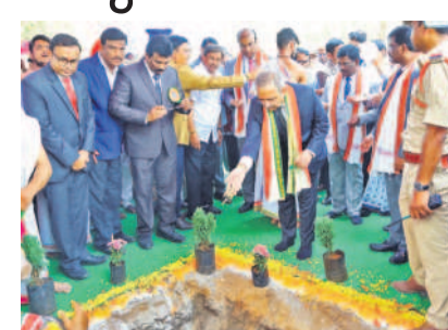
కోనాడలో నూతన కోర్టు భవన సముదాయానికి శంకుస్థాపన చేస్తున్న హైకోర్టు సీట్ అలోక ఆరాధే

హైకోర్టు సీట్ జస్టిస్ లలోక ఆరాధే కోనాడలో కోర్టు స్థాపన