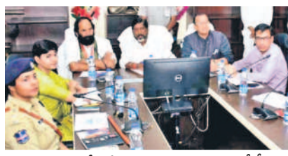
అధికారులతో సమీక్ష నిర్వహిస్తున్న డిప్యూటీ సీఎం భట్టి విక్రమారావు, మంత్రులు వెంకటరెడ్డి, ఉత్తమ్

పెరుగుతున్న అంచనాలతో ఖజానాపై భారం స్థానికులకు ఉద్యోగ అవకాశాలపై దృష్టి పెట్టాలి సమీక్షలో డిప్యూటీ సీఎం, మంత్రులు