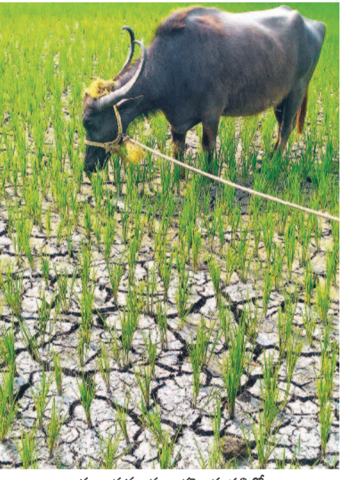
దుబ్బాక మండలం రహేత్తంపల్లిలో ఎండిన పొలాన్ని పశువులకు మేతకు వదిలేసిన రైతులు

నిరుడు ఎండలోనూ మత్తళ్లు.. నేడు నెర్రెలిచ్చిన చెరువులు ముందుచూపులేని కాంగ్రెస్ సర్కారు.. రైతన్నకు కన్నీరు