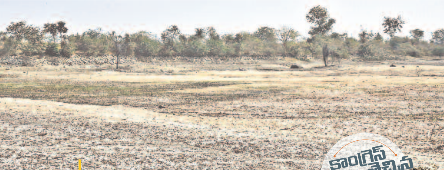
సిద్దిపేట జిల్లా నారాయణరావుపేట మండలం కోడండరావుపల్లిలో నీళ్లులేక బోసిపోయిన పల్లె చెరువు

మహబూబ్ నగర్ (నమస్తే తెలంగాణ ప్రతినది) / వనపర్తి (నమస్తే తెలంగాణ), ఫిబ్రవరి 24: ఓ మిల్లర్ సీఎంఆర్ ధాన్యాన్ని జిల్లా దాటించి అక్రమంగా దాచుకొన్నారు. ఆ విషయం తెలుసుకొన్న మరో ముఠా దొంగతనంగా ఆ ధాన్యాన్ని తరలించుకుపోయి అమ్ముకొంటున్నది. సినిమా కథలా ఉన్న ఈ ఘటన వనపర్తి జిల్లాలో కలకలం రేపుతున్నది. ట్విస్ట్ ఏమీ టంట్ దొంగసామును డోపిడీ చేసిన ముఠా వెనుక ఓ మంత్రి ఉన్నారనే ఆరోపణలు రావటమే. ధాన్యం బస్తాలు అక్రమంగా తరలించేందుకు >3వ పేజీలో