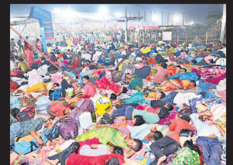
తాత్కాలిక బస్టాండ్ అవరణలోనే పడిగాపులు గాస్తున్న ప్రయాణికులు

తాడూరు, ఫిబ్రవరి 23 : మేడారం జాతీయ హోదా ఇవ్వాలని, ఈ ప్రాంత అభివృద్ధి కోసం మంత్రులతో కమిటీ వేసి తానే పర్యవేక్షిస్తానని సీఎం రేవంత్ రెడ్డి అన్నారు. సుక్రవారం ఆయన సమ్మక్క-సారలమ్మను దర్శించుకొని ఎత్తు బంగారం సమర్పించారు. ఆసన తరం విలేకరుల సమావేశంలో మాట్లాడారు. ఆరు గ్యారంటీడ్ బాగాంగా ఈ నెల 27న మరో రెండు హోమీలును ప్రారంభిస్తామని రూ.500కే గ్యాస్ సిలిండర్, తెల్లరేషన్ కార్డు ఉన్న ప్రతి కుటుంబానికి 200 యూనిట్ల వరకు ఉచిత విద్యుత్ ఇచ్చే కార్యక్రమాన్ని ప్రారంభిస్తామని