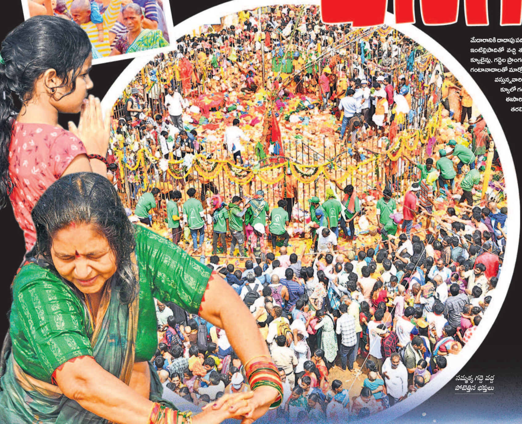
సమ్మక్క గద్దె వద్ద పోటిత్తిన భక్తులు