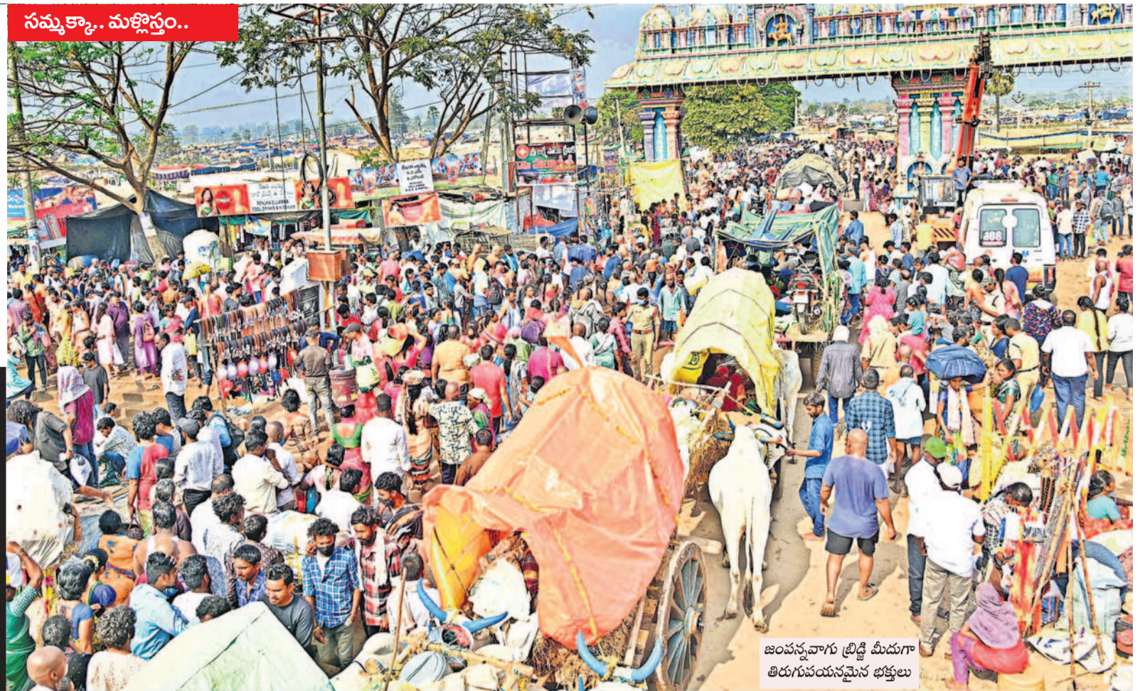
జంపన్నవారం బ్రిడ్జి మీదుగా తిరుగుపయనమైన భక్తులు

రాజులు కొండానికి అదే సమయంలో వెళ్లిపోతారు. అదివాసీ గిరిజన సంప్రదాయాల ప్రకారం వడ్డెలు గద్దెల వద్ద ప్రత్యేక పూజలు చేసి తల్లులను తిరిగి సాగనంపుతారు. ఈ తంతును వనప్రవేశంగా పిలుచుకునే ఆచారం కొనసాగుతూ వస్తున్నది.