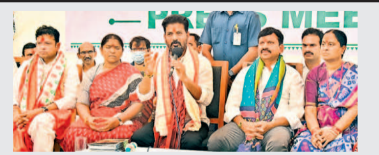
విలేకరుల సమావేశంలో మాట్లాడుతున్న ముఖ్యమంత్రి రేవంత్ రెడ్డి

మేడారానికి దాదాపు పది కోట్ల మంది విస్తీర్ణంలో గుడాలాలు ఏర్పాటు చేసుకున్న భక్తులు ఇంటిల్లిపాదితో వచ్చి సుక్రవారం తల్లులను దర్శించుకునేందుకు బారులు తీరారు. క్యూలైన్లు, గద్దెల ప్రాంగణంలో దర్శనానికి పోటిత్తిారు. గద్దెల ప్రాంగణం ఎడతెరిపిలేని గంటనాదాదాపు మార్చి గింది. నత్తిన బంగారం ముద్దలు, చంకన పిల్లలను ఎక్కుకొని వస్తున్నవారిలో రోడ్లన్నీ కిక్కిరిసిపోయాయి. మధ్యాహ్నం ఎండ ఉన్నా, క్యూలో గంటల తరబడి వేచి ఉండి అమ్మ వార్లకు మొక్కులు ముట్టజెప్పారు. ఈసారి మహాశాతరకు సుక్రవారం వరకు కోటి 50 లక్షల మంది వరకు తరలివచ్చారని రాష్ట్ర దేవాలయ శాఖ అధికారులు వెల్లడించారు.