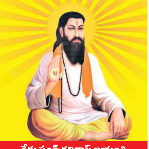
నేడు సంత రవిదాస్ జయంతి

రష్యా అధ్యక్షుడు వ్లాదిమిర్ పుతిన విమర్శకుల్లో ఒకరైన అలెక్సీ నావల్నీ తాను నమ్మిన సిద్ధాంతాలకు అంతిమ మూల్యం చెల్లించుకున్న వ్యక్తిగా నిలిచారు. నావల్నీ మరణానికి ఆర్మీడ్ జైలులో 'ఆకస్మిక మరణ సిండ్రోమ్' కారణమని రష్యా అధికారులు చెబుతున్నారు. కానీ, వ్లాదిమిర్ పుతిన అతన్ని జైలులో చంపి, ఆపై ఆనవాళ్ళను కప్పిపుచ్చడానికి మృతదేహాన్ని దాచారని అతని భార్య ఆరోపించారు. పుతిన పాలనాకాలంలో రష్యాలో అలాంటి గొంతులు భారీ మూల్యం చెల్లించుకోవడం పరిపాటిగా మారింది.