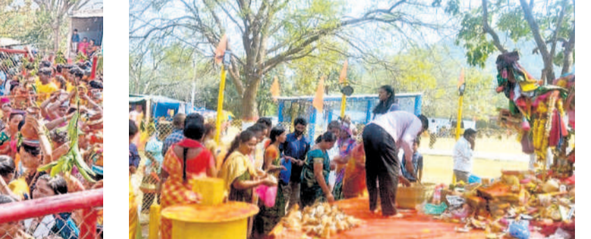
చుంచుపల్లి: అమ్మవారికి మొక్కలు చెల్లించుకుంటున్న భక్తులు