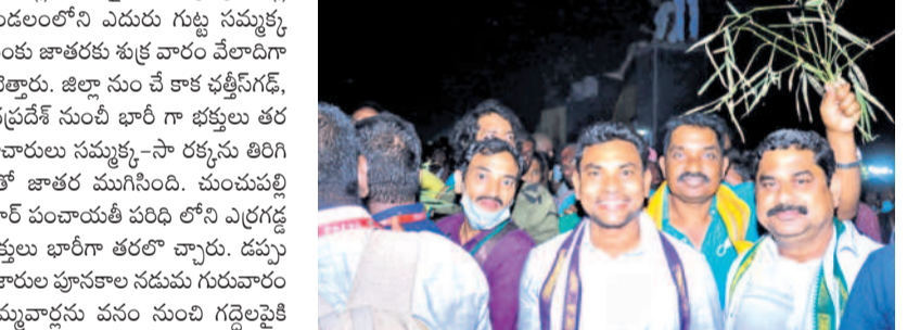
మణుగూరు టౌన్ : మేదారం జాతరలో మాజీ ఎమ్మెల్యే గౌ