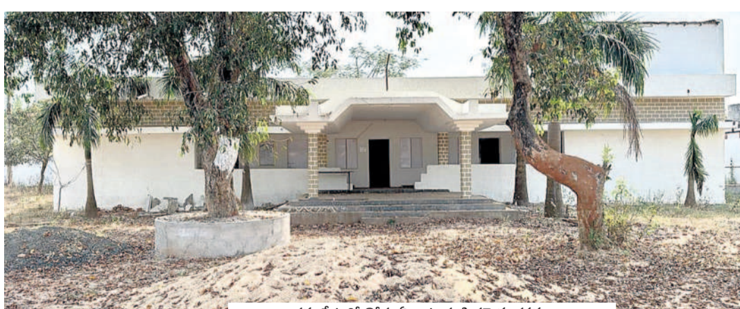
దమ్మపేటలో కోర్టు ఏర్పాటుకు సిద్దమైన భవనం