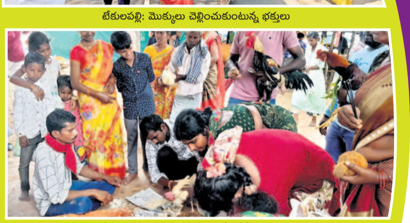
బేకలుపల్లి: మొక్కలు చెల్లించుకుంటున్న భక్తులు

అక్షయవ్రతం/కోత్తగూడెం అర్చన/ తిరుమలాయాత్రా/ బేకలుపల్లి/ చుంచుపల్లి/ చర్ల/ మణుగూరు/ ఇల్లెందుల రూరల్/ కోత్తగూడెం అర్చన, ఫిబ్రవరి 23: వన దేవతల ఆగమంతో అడవిపల్లి పులకించింది. ఆత్మత్వ సారక్ష్మ శివలక్ష్మీతో వనం ఆధ్యాత్మిక శోభను సంతరించుకున్నది. బంగారం (బెల్లం) సమర్పణ, ఊరేగింపులు, భక్తుల పూజలతో హోరెత్తింది. ఆత్మత్వన అడివారి పూజలతో ఉమ్మడి ఖమ్మం జిల్లా పునీతమైంది. భద్రాద్రి జిల్లా చర్ల మండలంలోని ఎదురు గుట్ట సమూహ సారక్ష్మ సంఘం జాతరకు శుక్రవారం వేలాదిగా భక్తులు పాల్గొన్నారు. జిల్లా సుందేవి కాక భక్తినగర్, జిడికా, ఆంధ్రప్రదేశ్ నుంచి భారీగా భక్తులు తరలివచ్చారు. గణాంకాలు సమూహ సారక్ష్మను తిరిగి గుట్టకు చేర్చడంతో జాతర ముగిసింది. చుంచుపల్లి మండలం గౌతంపూర్ పంచాయతీ పరిధి లోని ఎల్లగడ్డ మి మేదారానికి భక్తులు భారీగా తరలి వచ్చారు. డప్పు వాద్యాల, గిరిజన పూజలను పూజల నడుమ గురువారం రాత్రి నిర్వాహకులు అమ్మవార్లను వనం నుంచి గద్దెలపైకి తీసుకొచ్చి ప్రతిష్ఠించారు. గద్దెలపై కొలువైన వన దేవతలను