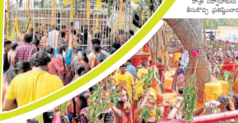
మణుగూరు టౌన్: మణుగూరులో కిక్కిరిసిన భక్తజనం