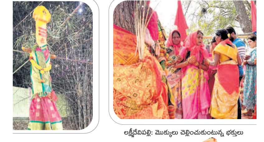
లక్ష్మీదేవిపల్లి: మొక్కలు చెల్లించుకుంటున్న భక్తులు

3 ఖమ్మం, శనివారం 24 ఫిబ్రవరి 2024 BHADRADRI KOTHAGUDEM