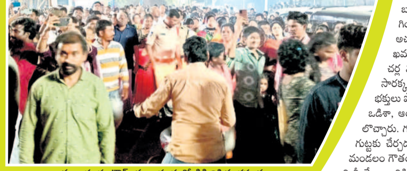
చర్ల: మొక్కలు చెల్లించుకుంటున్న భక్తులు