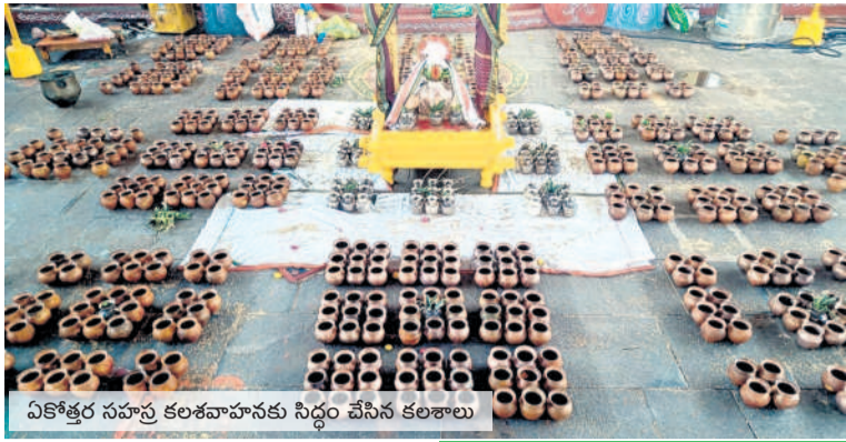
వికోత్తర సహస్ర కలశవాహనకు సిద్ధం చేసిన కలశాలు