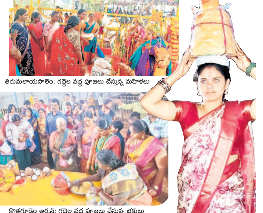
తిరుమలాయాత్ర: గద్దెల వద్ద పూజలు చేస్తున్న మహిళలు