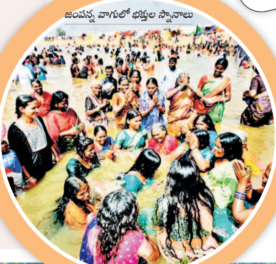
జంపన్న వారులో భిక్షుల స్నానాలు