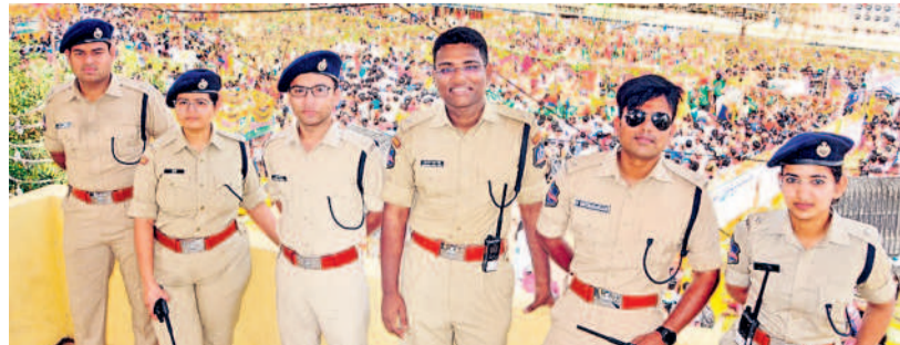
జాతర బందోబస్తులో పోలీసు అధికారులు