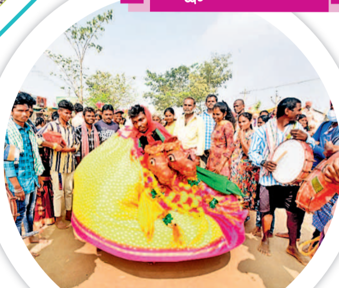
జాతరలో సంప్రదాయ నృత్యం చేస్తున్న లక్ష్మీదేవర