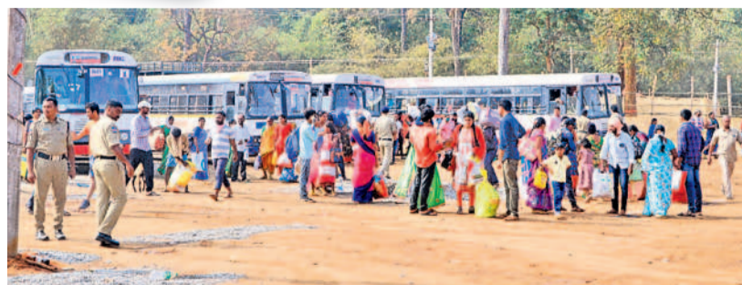
మేడారం బస్ పాయింట్ వద్ద భిక్షులు