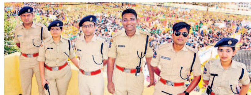
జాతర బందోబస్తులో పోలీసు అధికారులు