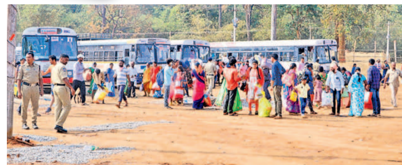
మేడారం బస్ పాయింట్ వద్ద భిక్షులు