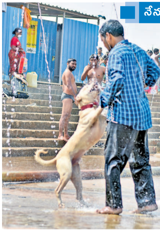
జంపన్నవారులో పెంపుడు కుక్క స్నానం చేయిస్తున్న భిక్షుడు

వాజేడు : మేడారం వనదేవతలను దర్శించుకోవడానికి చాలా మంది కుటుంబ సమేతంగా వచ్చారు. ఓ వ్యక్తి తన పెంపుడు కుక్కను కూడా తీసుకొచ్చి ఇలా జంపన్నవారులో బ్యాటరీ ఆఫ్ ట్యాప్స్ కింద స్నానం చేయిస్తూ కనిపించగా 'నమస్తే' క్రిక్మనిపించింది.