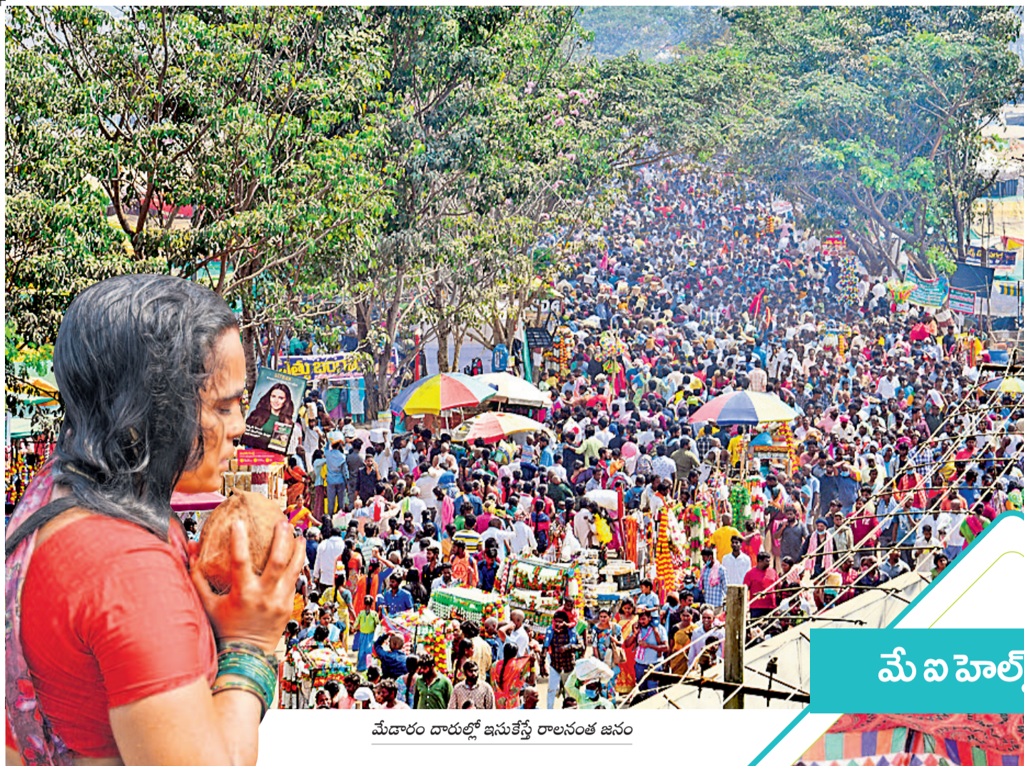
మేడారం దారుల్లో ఇసుకేస్తే రాలనంత జనం