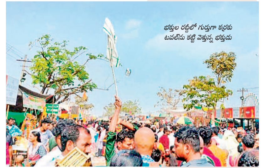
భక్తుల రద్దీలో గుర్తుగా కర్రకు టపాల్ను కట్టి వెళ్తున్న భక్తుడు