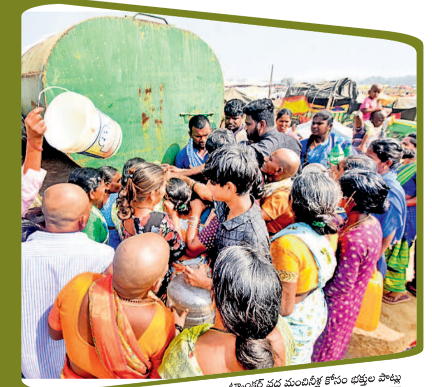
ట్యాంకర్ వద్ద మంచినీళ్ల కోసం భక్తుల పొట్లు