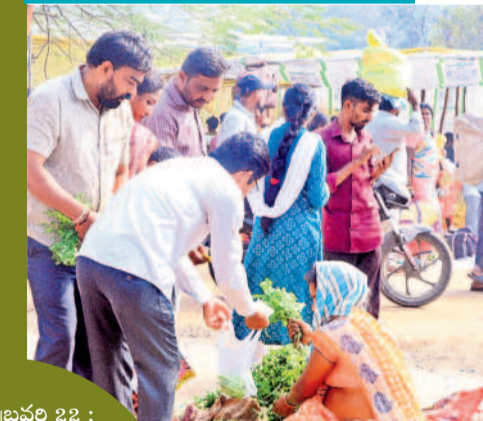
వాజేడు, ఫిబ్రవరి 22 : మేడారం జాతరలో కొత్తిమీర మస్తు పిరంమంది. ముటన్, బిరెన్, కూరగాయలు.. ఏ కూరైనా కొత్తిమీర తప్పకుండా వేసుకోవాల్సిందే. అందుకే గిరాకీ బాగా పెరిగి.. చిన్న కట్టకే రూ. 50 పలుకుతోంది. అయినప్పటికీ జనం కొనుగోలు చేస్తున్నారు.