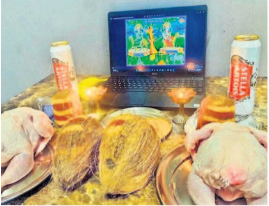
ల్యాప్ టాప్ ముందు తల్లులకు సమర్పించేందుకు ఉంచిన బెల్లం, కొబ్బరికాయలు, కోళ్లు