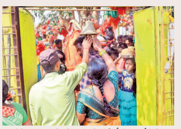
జంపన్న వాగు ఒడ్డున ఉన్న నాగులమ్మ గుడిలో పూజలు చేస్తున్న భక్తులు