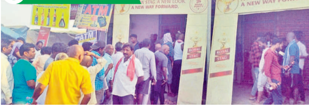
తాడ్యాయి, ఫిబ్రవరి 22 : మేడారం మహాజాతరలో మందుబారులు మధ్యం కోసం బారులుదీరుతున్నారు. సమ్మక్క - సారలమ్మలను దర్శించుకునేందుకు భక్తులు గురువారం పెద్ద సంఖ్యలో చేరుకున్నారు. ప్రభుత్వం జాతర పరిసరాల్లో 22 వైస్స్ షాపులను కేటాయించగా, ఆయా షాపుల్లో మధ్యం ధరలు ఎక్కువగా ఉన్నాయి. గ్రామంలో గతంలో సాధారణంగా కేటాయించిన వైస్స్ షాపుల్లో ఎమ్మార్వీకే అమ్ముతున్నారు. దీంతో మందుబారులు కూర్చున్నారు. మధ్యం కొనుగోలుకు ఎగబడుతున్నారు.