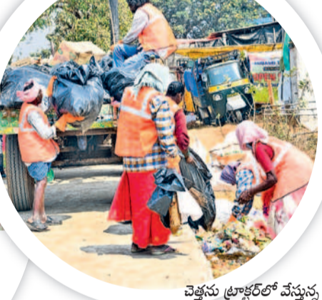
వెత్తను ట్రాక్టర్లో వేస్తున్న పాలిశుద్ధి కార్మికులు