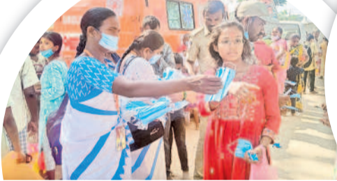
ములుగు రూరల్ : జాతరలో భక్తులకు వైద్యార్థులు శాఖ మాస్కులు పంపిణీ చేస్తోంది. టీఎంఎంఎస్ ఐడీసీ ఎండ్ అర్బీ కర్ణ ప్రభుత్వం ద్వారా 15లక్షల మాస్కులు సరఫరా చేశారు. సెంట్రల్ డ్రగ్ స్టోర్ నుంచి తెప్పించి భక్తులకు ఇస్తున్నట్లు డీఎంహెచ్ఓ అర్బీ అభ్యుదయ తెలిపారు. వాటిని భక్తుల ఆరోగ్య సంరక్షణ కోసం సిబ్బంది ఇలా అందిస్తున్నారు.