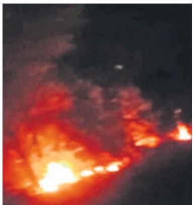
-పూడూరు, ఫిబ్రవరి 22

మండలంలోని దామగుండం రామలింగేశ్వరాలయ ప్రాంతంలోని అడవిలో గత ఐదురోజులుగా మంటలు చెలరేగుతున్నాయి. అటవీలో గుర్తుతెలియని వ్యక్తులు నిప్పు అంటించడంతో భారీగా మంటలు చెలరేగుతూ.. పొగ వ్యాపిస్తున్నది. దీంతో ఆ ప్రాంతంలోని జంతువులు, పక్షులు మృతి చెందడంతోపాటు పెద్ద, పెద్ద వృక్షాలు కాలిపోతున్నాయని స్థానికులు ఆవేదన వ్యక్తం చేస్తున్నారు. ఆయుర్వేద వనమూలికలు నాశనమవుతున్నాయని వాపోతున్నారు. నేపీ రాధార్ కేంద్ర ఏర్పాటుకు ప్రభుత్వం అనుమతించడంతో గుర్తుతెలియని వ్యక్తులు కావాలనే ఈ అటవీలో నిప్పుపెట్టారనే ఆరోపణలు విని పిస్తున్నారు. ఇప్పటికైనా అటవీశాఖ అధికారులు స్పందించి చర్యలు తీసుకోవాలని కోరుతున్నారు.