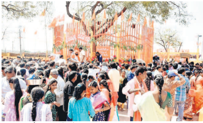
ఫలిజెరనీలే : జనగామలోని గోదావరినది ఒడ్డున గద్దెల వద్ద మొక్కులు నమర్చుకున్న భక్తులు