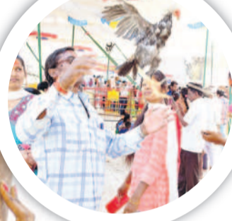
కరీంనగర్ : రేకుల్లో కోడి పుంజును ఎగరేస్తున్న భక్తుడు