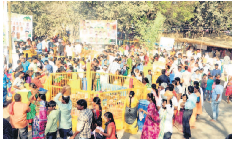
నుల్లూనాబాద్ రూరల్ : నీరుకట్లలో మొక్కులు చెల్లించుకుంటున్న భక్తులు