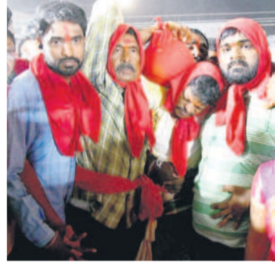
కరీంనగర్ : రేకుల్లో గద్దెపైకి సమ్మక్కను తీసుకువస్తున్న కోయపూజారులు