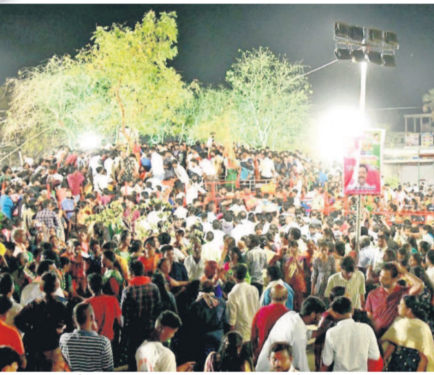
కరీంనగర్ : రేకుల్లో సమ్మక్క-సారలమ్మను దర్శించుకునేందుకు పెద్ద సంఖ్యలో తరలి వచ్చిన భక్తజనం