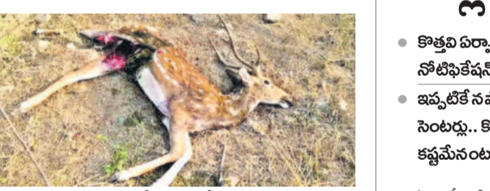
తిరుమల గట్టు సమీపంలోని పొలంలో మృతి చెంది ఉన్న జింక