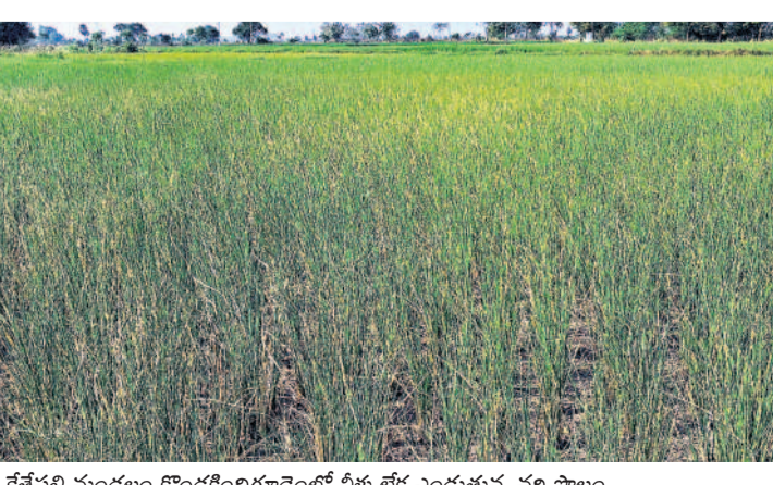
కేతపల్లి మండలం కొండకిందిగూడెంలో నీళ్లు లేక ఎండుతున్న వరి పొలం

బీఆర్ఎస్ ప్రభుత్వం ఉన్నప్పుడు చెత్త సేకరణకు సమస్య లేకుండా కాలనీల్లోని చెత్తను వాహనాలు ఎప్పటికప్పుడు డంపింగ్ యార్డుకు తరలించేవి. కాంగ్రెస్ ప్రభుత్వం ఏర్పడిన రెండు నెలల నుంచి నందికొండ మున్సిపాలిటీని పాలకులు పట్టించుకోవడం లేదు. మున్సిపాలిటీ నిర్వహణకు, మున్సిపల్ వాహనాలకు డీజిల్ ను సమకూర్చడంలో స్థానిక ఎమ్మెల్యే, అధికారులు పట్టించుకోవడం లేదని మున్సిపల్ సిబ్బంది, ప్రజలు ఆవేదన వ్యక్తం చేస్తున్నారు. ఇక మున్సిపల్ పారిశుధ్య కార్మికులు, సిబ్బందికి జీతాలు కూడా సకాలంలో రావడం లేదు. దాంతో వారు ఆర్థికంగా ఇబ్బందులు ఎదుర్కొంటున్నారు. దీనిపై మున్సిపల్ కమిషనర్ శ్రీనివాసను వివరణ కోరగా మున్సిపల్ చెత్త వాహనాల డీజిల్ కేటాయింపులను సంబంధించి నిధులు ప్రభుత్వం నుంచి రావాల్సి ఉన్నదని తెలిపారు. పారిశుధ్య కార్మికులు, సిబ్బంది జీతాలు కూడా చెల్లించాల్సి ఉన్నదని, ఈ విషయాన్ని ఉన్నతాధికారుల దృష్టికి తీసుకెళ్లమని చెప్పారు.