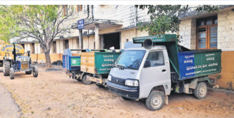
నందికొండ మున్సిపల్ కార్యాలయంలో నిలిచి ఉంచిన చెత్త సేకరణ వాహనాలు

రెండు నెలలుగా కార్యాలయంలోనే.. పారిశుధ్య కార్మికులకూ నిలిచిపోయిన జీతాలు నందికొండ మున్సిపల్ లో దారుణం