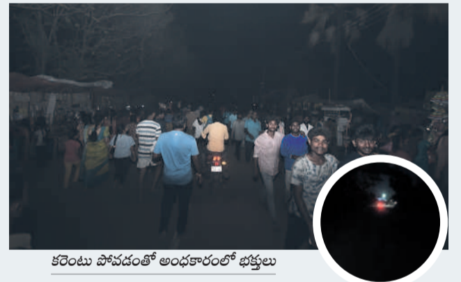
కరింట్లు పోవడంతో అంధకారంలో భక్తులు