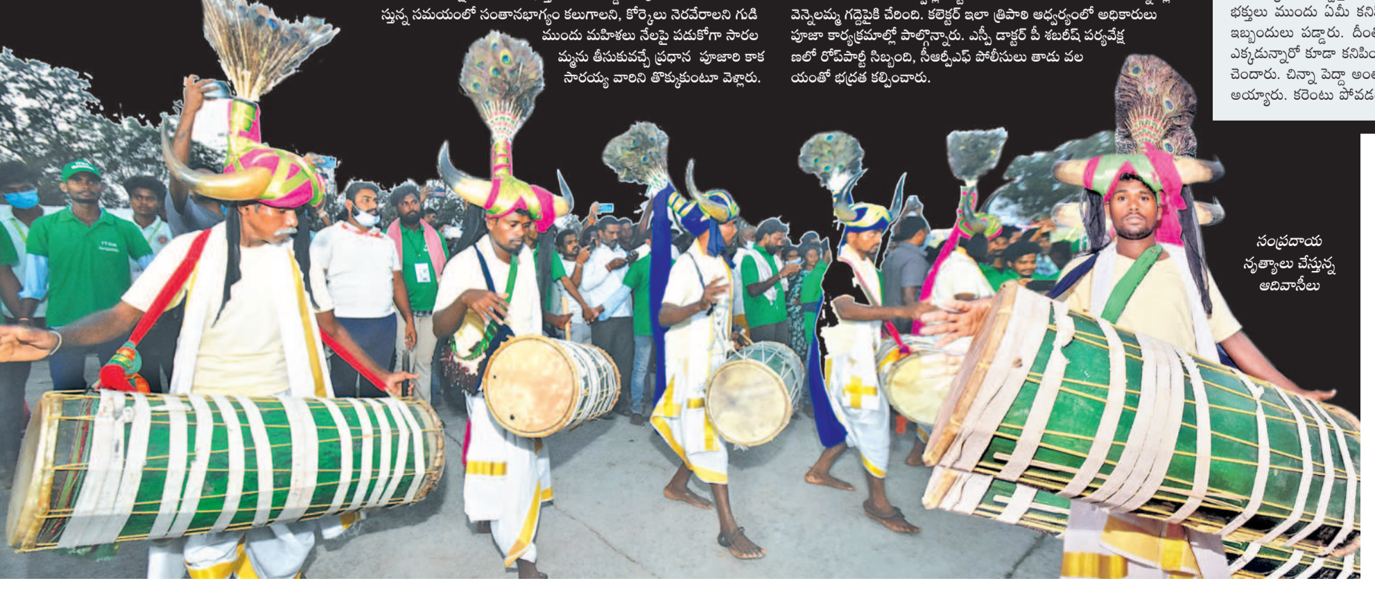
సంప్రదాయ నృత్యాల చేస్తున్న ఆదివాసీలు

20 నిమిషాల పాటు కరింట్ కట్.. తీవ్ర ఇబ్బందులు పడ్డ భక్తజనం ఏటూనాగారం/తాడ్వాయి, ఫిబ్రవరి 21 : మేడారంలోని జంపన్నవారి ప్రాంతంలో బుధవారం రాత్రి విద్యుత్ సరఫరాలో అంతరాయం ఏర్పడింది. దీంతో సుమారు 20 నిమిషాల పాటు జంపన్న దుర్గాదాలు, చీకటి అలమటింది. గల స్తూపం వరకు పూర్తిగా అంధకారమైంది. కరింట్లు పోవడంతో ఒక్కసారిగా వ్యాపారులు, భక్తులు తీవ్ర ఆసోకాన్ని గురయ్యారు. రోడ్డుపై లక్షలాదిగా ఉన్న వ్యాపారులు అందోళన చెందారు. అదీగాక దోంగలు భయం అందరినీ కలచివేసింది. కరింట్లు ఎందుకు పోయిందో తెలియక కరింట్లు అధికారులు, పోలీసులు వెరలెస భక్తులు ముందు ఏమీ కనిపించక చాలా ఇబ్బందులు పడ్డారు. దీంతో తమవారు ఏకడన్నారో కూడా కనిపించక అందోళన చెందారు. చిన్నా పెద్దా అంతా ఆగమాగం కరింట్లు పునరుద్ధరించడంలో అందరూ ఆయ్యారు. కరింట్లు పోవడంతో స్నానఘ