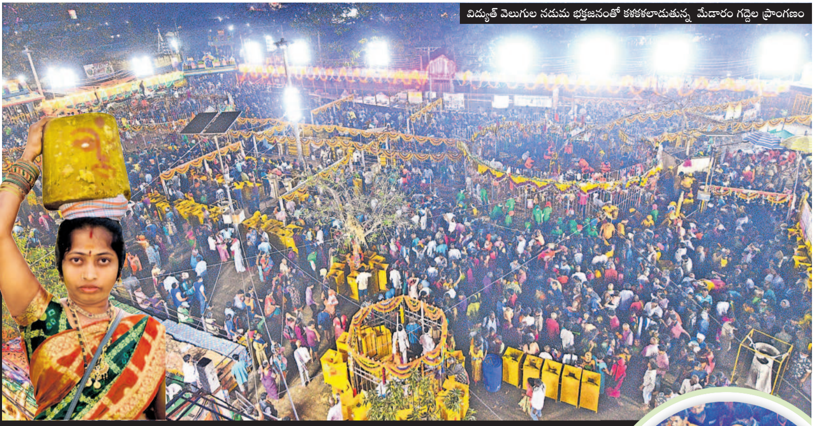
విద్యుత్ వెలుగుల నడుమ భక్తజనంతో కళకళలాడుతున్న మేడారం గద్దెల ప్రాంగణం