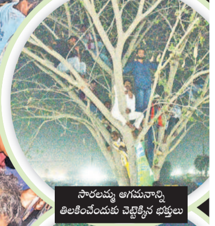
సారలమ్మ ఆగమనాన్ని తిలకించేందుకు వెళ్లిన భక్తులు