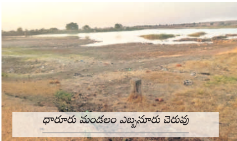
ధారులు మండలం ఎల్లప్పుడూ చెరువు

13 హైదరాబాద్, గురువారం 22 ఫిబ్రవరి 2024 | VIKARABAD