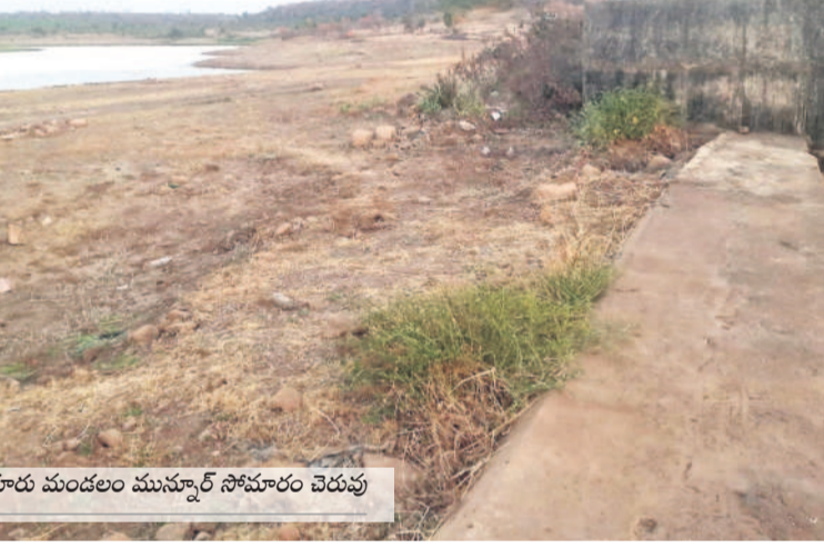
ధారులు మండలం మున్నూర్ సోపూరు చెరువు