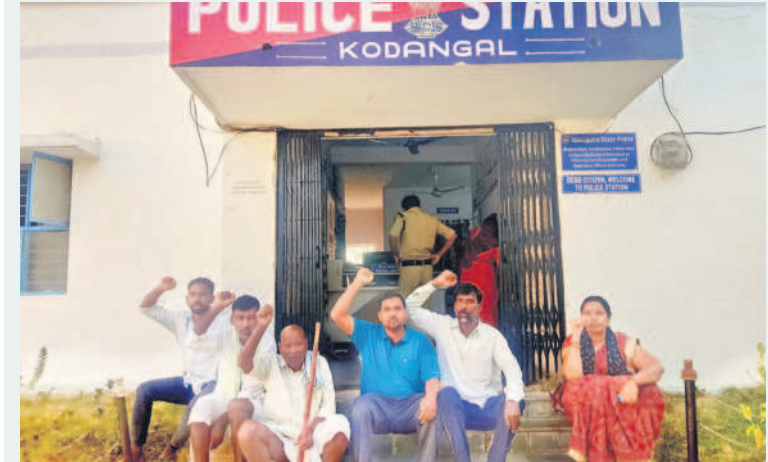
కొడంగల్ పోలీస్ స్టేషన్ ఎదుట ఆందోళన చేస్తున్న అస్పాయివల్లి రైతులు

రైతులను అరెస్టు చేయడమేనా.. ప్రజా పాలనంటే..?