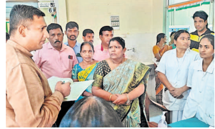
కొడిపల్లి ప్రభుత్వ దశాబ్దానికి రికార్డులు పరిశీలించు, కలెక్టర్ రాజిరెడ్డి

కొడిపల్లి దశాబ్దానికి కేటాయించినట్లు తెలిపారు. తనిఖీ చేసే సమయంలో దశాబ్దానికి అనుమతి లేకుండా విధులకు హాజరు కాని సిబ్బందిపై చర్యలు తీసుకోవాలని వైద్యాధికారులను ఆదేశించారు. జాతీయ రహదారి పక్కన కొడిపల్లి దశాబ్దానికి గ్రామీణ ప్రజలు అధికంగా వస్తారని, సిబ్బంది సమయపాలన పాటించి వైద్యసేవలు అందించాలని సూచించారు. కలెక్టర్ వెంట ఉన్నట్లు డివిజన్ డిప్యూటీ సెలెక్షన్, హెచ్ఎం ఈ మంగ, హెచ్ఎం సురేందర్, సీపీఎస్ఐ రెండో దశాబ్దానికి కొడిపల్లి ప్రభుత్వ దశాబ్దానికి గుర్తింపు ఉండవచ్చు. మహిళల ఆరోగ్య సంరక్షణకు ఏడుగురు స్టాఫ్ సర్దుచూరే తదితరులు ఉన్నారు.