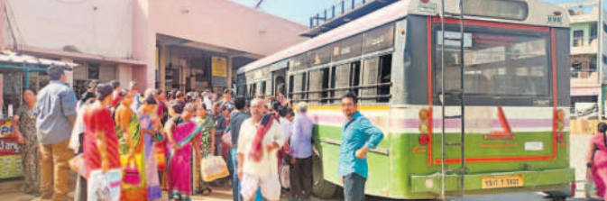
రామాయంపేట లోని బస్సుల కొరతను ప్రయాణికులు

రామాయంపేట, ఫిబ్రవరి 21 : మేడారం సమృద్ధి, సారలమ్మ జాతర నేపథ్యంలో గ్రామాల్లోకి వచ్చే ఆర్టీసీ బస్సుల సంఖ్య తగ్గించి, దీంతో ప్రయాణికులు తీవ్ర ఇబ్బందులు పడుతున్నారని. సరిపడా బస్సులు రాకపోకల దంతో ప్రయాణికుల రద్దీ పెరిగింది. పలి తంగా బస్సుల్లో నిలబడడానికి సైతం స్థలం ఉండడం లేదు. బుధవారం రామాయంపేట బస్సులో అసౌకర్యాలను ప్రయాణికులు మౌనంగా వ్యక్తం చేశారు.