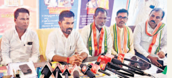
మహిళా అధ్యక్షుల భాగస్వామి ఎమ్మెల్యే వెచ్చ బోజు పేర్

ఉమ్మడి, ఫిబ్రవరి 21: పంచాయతీ రాజ్, శివ సంక్షేమ శాఖ మంత్రి సీతక్కపై ప్రచారం చేస్తే ఊరుకోం. ఓ పవరను గ్రామాల్లో నిషేధిస్తాం. నమస్తే తెలంగాణపై ఎమ్మెల్యే వెచ్చ బోజు పేర్