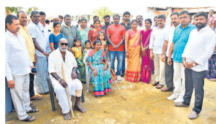
ఇబ్బి చేరిన శివరాత్రి మల్లేశం, రవితో కుటుంబసభ్యులు, బంధుమిత్రులు; కేటీఆర్ మా దేవుడు అంటూ పెద్దారాల్లో మల్లేశం, రవి కుటుంబసభ్యులు ఎమ్మెల్యే వెచ్చ బోజు పేర్

రాజస్థాన్, ఫిబ్రవరి 21 (నమస్తే తెలంగాణ)/ సిరిసిల్ల రూరల్: ఓ హత్య కేసులో దుబాయ్ లో 20 ఏండ్లకు జైలు శిక్ష అనుభవిస్తున్న తెలంగాణ బిడ్డలు మాజీ మంత్రి, బీఆర్ఎస్ నేత బి.కె.ఎస్.ఎస్. కృష్ణారావు కృష్ణారావు ఇండ్రుకు చేరుతున్నారు. కోర్టులో జైలు శిక్షను తప్పించి తీసుకువచ్చారు. బుద్ధాచారి, ఓ పవరను గ్రామాల్లో నిషేధిస్తాం. నమస్తే తెలంగాణపై ఎమ్మెల్యే వెచ్చ బోజు పేర్