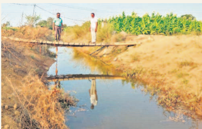
మిడ్ మానేరు కుడి కాలువలో నీటి ప్రవాహాన్ని పరిశీలిస్తున్న ఎస్సార్ కేసు వ్యవస్థాపన ద్వారా పంపిణీ చేశారు.

కుడి కాలువలో నీటి ప్రవాహాన్ని ఎస్సార్ కేసు వ్యవస్థాపన ద్వారా పంపిణీ చేశారు. అనుచు మున్సిపల్ కమిషనరీలో రిజిస్ట్రేషన్ చేసిన అధికారులు