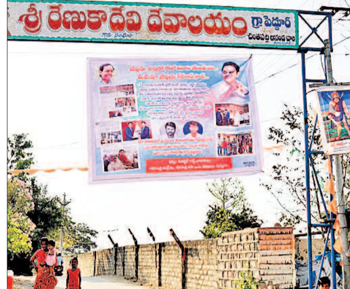
కేటీఆర్ సార సాయంతోనే విడుదలయ్యారం

కేటీఆర్ సార సాయంతోనే విడుదలయ్యారం. కేటీఆర్ సార సాయంతోనే విడుదలయ్యారం. కేటీఆర్ సార సాయంతోనే విడుదలయ్యారం. కేటీఆర్ సార సాయంతోనే విడుదలయ్యారం. కేటీఆర్ సార సాయంతోనే విడుదలయ్యారం.