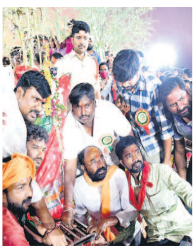
సారలమ్మను గడ్డెనే ప్రతిష్ఠిస్తున్న కోయి పూజారులు, భక్తులు

వన జాతరకు తెరలేచింది. డబ్బుచప్పుడు, ఒక్క కళాకారుల సృష్టాలు, శివసత్తుల పూసకాల సడమ కుంకుమ జరిణి రూపంలో ఉన్న సారలమ్మ బుధవారం సాయంత్రం గడ్డెనెక్కి డంతో సందడి మొదలైంది. ఉమ్మడి జిల్లావ్యాప్తంగా 80 చోట్లకు పైగా జాతరలు ఘనంగా ప్రారంభంకాగా, ప్రధానంగా రేచుర్, కేళ వపట్నం, హుజూరాబాద్ శివారులోని రంగనాయకులగుట్ట, వీణ వంక, గోదావరిఖని, గోలివాడ, నీరుకుల్ల, కొలనూర్, హస్తాంతు