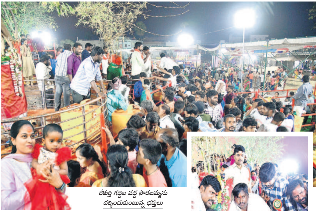
చేక్కు గడ్డల వద్ద సారలమ్మను దర్శించుకుంటున్న భక్తులు