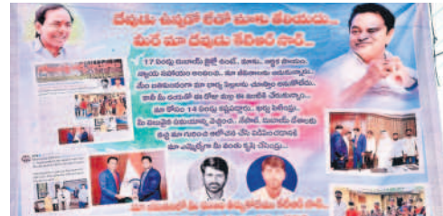
'కేటీఆర్ మాదేవుడు' అంటూ పెద్దూరులో కుటుంబ సభ్యులు, గ్రామస్థులు ఏర్పాటు చేసిన ప్లెక్సీ

మల్లేశం, రవి వద్ద టిక్కెట్ల డబ్బులైతే దుబాయ్లోనే ఆగిపోగా, విషయం తెలుసుకొని కేటీఆర్ టిక్కెట్ల సమకూరారు. దీంతో ఇద్దరూ బుధవారం తెల్లవారుజామున దుబాయ్ నుంచి స్వదేశానికి చేరుకున్నారు. అప్పటికే కేటీఆర్ ఆడేశాలతో బీఆర్ఎస్ నాయకులు కుటుంబసభ్యులను అక్కడికి తీసుకెళ్లి, ఆ ఇద్దరిని ఎయిర్ పోర్టు తీసుకొచ్చారు. ఇంటికి చేరిన మల్లేశం, రవి తమ తల్లిదండ్రులు, కుటుంబసభ్యులను చూసి ఉద్వేగానికి లోనయ్యారు. కొడుకులు, కూతుళ్ళు, మనుమలను సైతం చూసి పలకరిస్తూ.. ఆలింగనం చేసుకున్నారు. ఇటు తల్లిదండ్రులు 'కొడుకులారా..? మీమ్మల్ని ఇక్కడ చూస్తామనుకోలేదు' అంటూ కంటతడిపెట్టారు. తమ కొడుకులు కేటీఆర్ని చూడడంతో ఇంటికి చేరానని, ఆ సార్లు స్వంగా ఉండాలని కోరుకున్నారు. కేటీఆర్ కు కృతజ్ఞతగా గ్రామంలో కుటుంబ సభ్యులు, బంధువులు ప్లెక్సీలు ఏర్పాటు చేశారు.