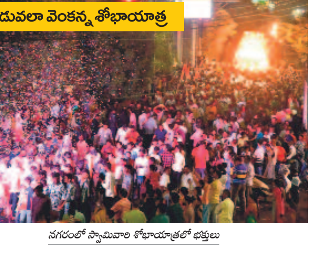
నగరంలో స్వామివారి శోభాయాత్రలో భక్తులు