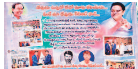
'కేటీఆర్ మాదేవుడు' అంటూ పెద్దూరులో కుటుంబ సభ్యులు, గ్రామస్థులు ఏర్పాటు చేసిన ప్లెక్సీ

మల్లేశం, రవి వద్ద టిక్కెట్ల డబ్బులేక దుబాయిలోనే ఆగిపోగా, విషయం తెలుసుకొని కేటీఆర్ టిక్కెట్లు సమకూరారు. దీంతో ఇద్దరూ బుధవారం తెల్లవారుజామున దుబాయి నుంచి స్వదేశానికి చేరుకున్నారు. అప్పటికే కేటీఆర్ ఆదేశాలతో బీఆర్ఎస్ నాయకులు కుటుంబసభ్యులను అక్కడికి తీసుకొని, ఆ ఇద్దరిని ఎయిర్ పోర్టు తీసుకొచ్చారు. ఇంటికి చేరిన మల్లేశం, రవి తమ తల్లిదండ్రులు, కుటుంబసభ్యులను చూసి ఉడ్డగ్రానికి లోనయ్యారు. కొడుకులు, కూతుర్లు, మనుమలను సైతం చూసి పలకరిస్తూ.. అలింగనం చేసుకున్నారు. ఇటు తల్లిదండ్రులు 'కొడుకులా..? మిమ్మల్ని ఇక్కడ చూస్తామనుకోలేదు' అంటూ కంటికి దీప్తిపెట్టారు. తమ కొడుకులు కేటీఆర్ సేవలు దయతోనే ఇంటికి చేరారని, ఆ సేవల సల్పాం ఉండాలని కోరుకున్నారు. కేటీఆర్ కృతజ్ఞతగా గ్రామంలో కుటుంబ సభ్యులు, బంధువులు ప్లెక్సీలు ఏర్పాటు చేశారు.