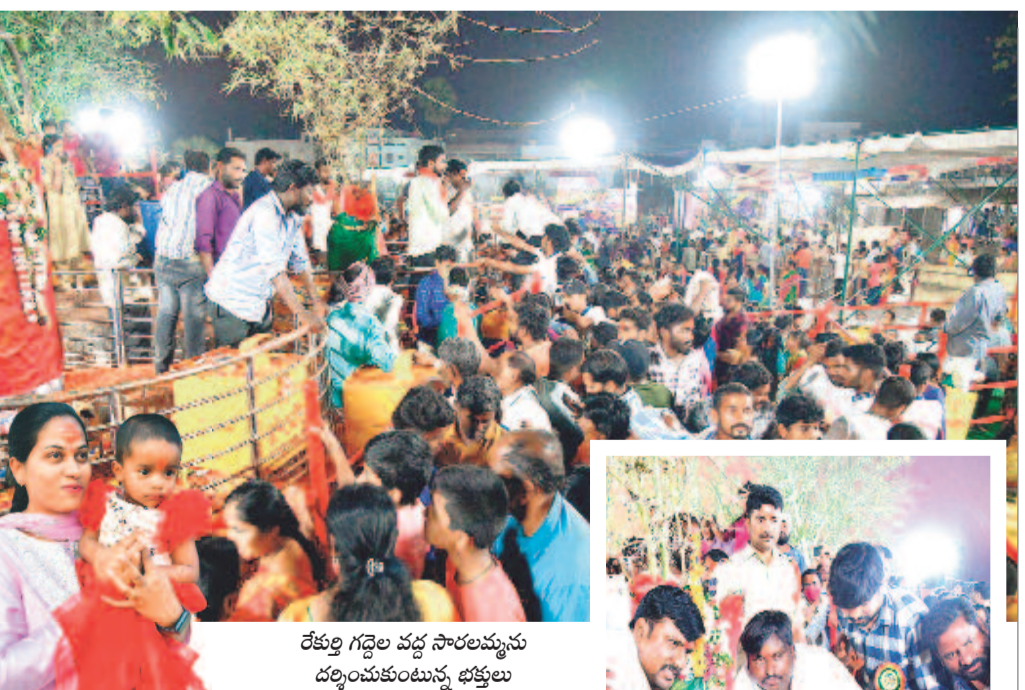
శేక్కు గద్దెల వద్ద సారలమ్మ దర్శించుకుంటున్న భక్తులు

గద్దెనెక్కిన సారలమ్మ • ఘనంగా వనజాతర మొదలు • ఉమ్మడి జిల్లావ్యాప్తంగా పోటెత్తిన భక్తులు • మొదటి రోజే పెద్ద సంఖ్యలో భక్తుల దర్శనం • నేడు కొలువదీసేస్తూ తల్లి సమ్మక్క • ఏర్పాట్లను పర్యవేక్షించిన యంత్రాంగం వన జాతరకు తెరలేపింది. డబ్బుచప్పుళ్లు, ఒక్క కళాకారుల సృష్టాలు, శివసత్తుల పూసకాల సడమ కుంకుమ జరిణి దావంతో ఉన్న సారలమ్మ బుధవారం సాయంత్రం గద్దెనెక్కి డంతో సందడి మొదలైంది. ఉమ్మడి జిల్లావ్యాప్తంగా 80 చోట్లకు పైగా జాతరలు మనంగా ప్రారంభంకాగా, ప్రధానంగా రేకుర్తి, కేశవపట్నం, హుజూరాబాద్ శివారులోని రంగనాయకులగుట్ట, వీణపంక, గోదావరిఖని, గోలివడ, నీరుకుల్లు, కొలనూర్, హనుంతు