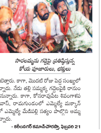
సారలమ్మను గద్దెపై ప్రతిష్ఠిస్తున్న కోయ పూజారులు, భక్తులు

గద్దెనెక్కిన సారలమ్మ • ఘనంగా వనజాతర మొదలు • ఉమ్మడి జిల్లావ్యాప్తంగా పోటెత్తిన భక్తులు • మొదటి రోజే పెద్ద సంఖ్యలో భక్తుల దర్శనం • నేడు కొలువదీసేస్తూ తల్లి సమ్మక్క • ఏర్పాట్లను పర్యవేక్షించిన యంత్రాంగం వన జాతరకు తెరలేపింది. డబ్బుచప్పుళ్లు, ఒక్క కళాకారుల సృష్టాలు, శివసత్తుల పూసకాల సడమ కుంకుమ జరిణి దావంతో ఉన్న సారలమ్మ బుధవారం సాయంత్రం గద్దెనెక్కి డంతో సందడి మొదలైంది. ఉమ్మడి జిల్లావ్యాప్తంగా 80 చోట్లకు పైగా జాతరలు మనంగా ప్రారంభంకాగా, ప్రధానంగా రేకుర్తి, కేశవపట్నం, హుజూరాబాద్ శివారులోని రంగనాయకులగుట్ట, వీణపంక, గోదావరిఖని, గోలివడ, నీరుకుల్లు, కొలనూర్, హనుంతు