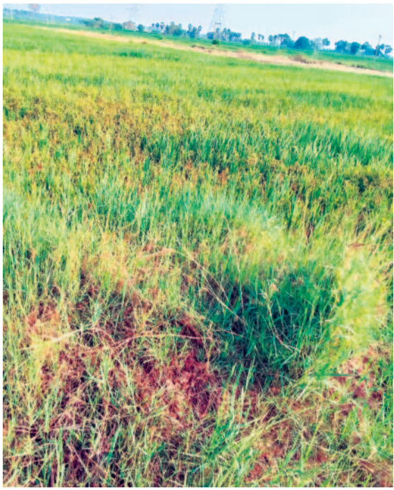
అనుముల మండలం రామదూర్ గ్రామంలో ఎండిన పరిపాించ

• దేవరకొండ ఎమ్మెల్యే బాలానాయక్ చంద్రపేట (దేవరకొండ), ఫిబ్రవరి 20 : నేరేడుగొమ్ము మండలాభివృద్ధి తన వంతుగా కృషి చేస్తానని దేవరకొండ ఎమ్మెల్యే నేనావట్ల బాలానాయక్ అన్నారు. మంగళవారం మండలంలోని పలు గ్రామాల్లో అభివృద్ధి పనులకు శంకుస్థాపన చేశారు. తిమ్మాపూర్, పలుగురుపల్లి, నేరేడుగొమ్ము, కొత్తపల్లి, పెద్ద మునిగల్, మోసంగిపల్లి, చిన్నమునిగల్, కాచరాజుపల్లి గ్రామాల్లో రూ.కోటి నిధులతో చేపట్టిన సీసీ రోడ్లు, గ్రామసంఘాలలో భవన నిర్మాణాల పనులకు ఆయన శంకుస్థాపన