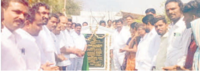
అభివృద్ధి పనులకు శంకుస్థాపన చేస్తున్న ఎమ్మెల్యే బాలానాయక్