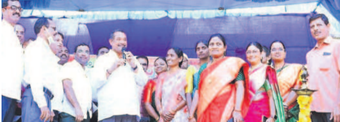
మిర్యాలగూడ : కళాశాల వార్షికోత్సవంలో మాట్లాడుతున్న ఎమ్మెల్యే బీఎల్ఆర్