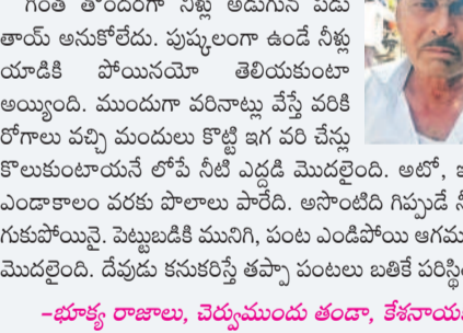
బోదరవారండాలో బోర్ వెలుస్తున్న రైతు