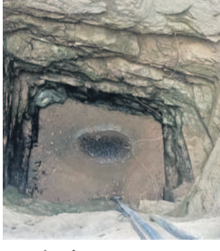
అక్కన్నపేటలో అడుగుంటి పోవటం బావి