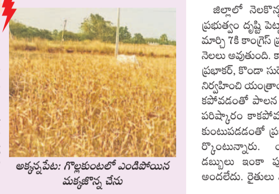
అక్కన్నపేట: గొల్లకుంటలో ఎండిపోయిన మక్కజొన్న వేసు

అధికార కరోబో కోతలు ఇప్పుడే రైతులకు ఇబ్బందులను గురిచేస్తున్నాయి. తరువాత కరోబో లోటోతో మోటులు కాలుతున్నాయని రైతులు ఆవేదన వ్యక్తం చేస్తున్నారు. కాల్య ద్వారా గోదావరి జిల్లా పూర్తిగానే విడుదల చేయకపోవడంతో చెరువులు, కుంటలు ఎండిపోతున్నాయి. భూగర్భజలాలు అడుగుంటి పోతుండడంతో పంటలను కాపాడుకోవడానికి రైతులు అందోళన చెందుతున్నారు. గ్రామాల్లో తాగునీటి సమస్యలు మొదలయ్యాయి. పడేడ్లలో ఎన్నడూ తాగునీటి సమస్యలపై ధర్మాలు, అందోళనలు జరగలేదు. ప్రభుత్వం కాంగ్రెస్ సర్కారులో ఆ పరిస్థితి నెలకొంది. వారం రోజుల్లో ఇంటర్ పరీక్షలు ప్రారంభమవుతున్నాయి. ఇప్పటికే ప్రాక్టీస్ ప్రారంభమయ్యాయి. సూర్యోలో పదోతరగతి పరీక్షలు జరుగుతాయి. పరీక్షల నిర్వహణ, సన్నద్ధతకు మంత్రిలు కనీసం సమీక్ష చేయాలి. జిల్లాలో విద్యాశాఖ సైతం పూర్తి నిర్దిష్టతగా ఉంది. విద్యార్థులకు స్కాల్స్ సరిగా అందడం లేదు.