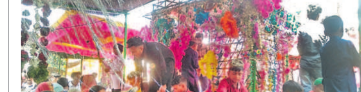
పీర్ గిట్ సాహెబ్ దర్గాస దర్శించుకుని ప్రత్యేక ప్రార్థనలు చేస్తున్న భక్తులు