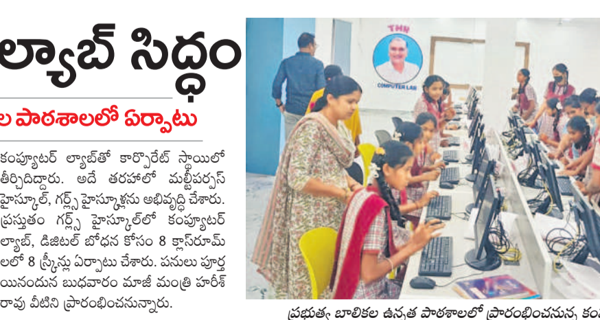
ప్రభుత్వ బాలికల ఉన్నత పాఠశాలలో ప్రారంభించున్న కంప్యూటర్ ల్యాబ్