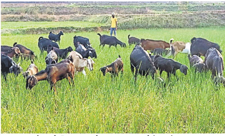
అక్కన్నపేట: బోదరవారండాలో ఎండిన పరి పొలంలో మేకలు మేపుతున్న కాపరి