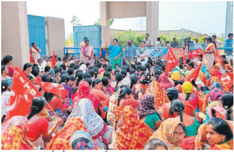
సీబిటియూ అధ్యక్షులలో కలెక్టరేట్ ఎదుట ధర్మా చేస్తున్న అంగన్వాడీలు