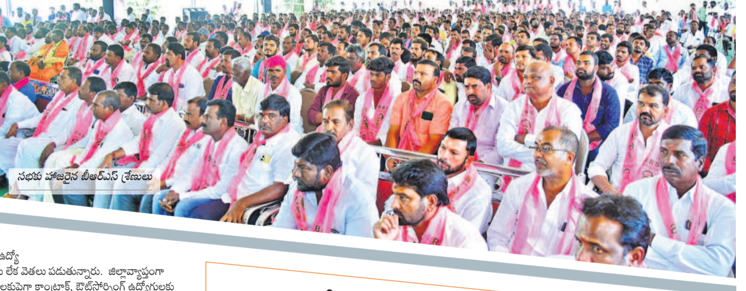
సభకు హాజరైన బీఆర్ఎస్ శ్రేణులు