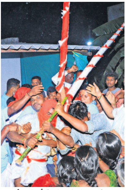
మేడారంలో మంగళవారం కన్నెపల్లి నుంచి జంపన్నను తీసుకొస్తున్న పూజారులు