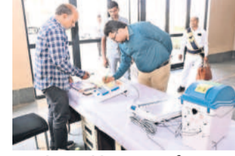
ఈవీఎంలు, వీవీ ప్యాట్లను పరిశీలించు కలెక్టర్ల సంఖ్య

సర్కారు, ఫిబ్రవరి 20 : సర్కారులోని కలెక్టర్ తోటాజి ఏర్పాటు చేసిన ఈవీఎంలు, వీవీ ప్యాట్ల అమారావాల కేంద్రాల కలెక్టర్ల దృష్టికి సంఖ్య మంగళవారం పరిశీలించారు. వచ్చే ఏప్రిల్ మొదటి వరకు ఏర్పాటు చేసిన ఈవీఎంలు, వీవీ ప్యాట్ల కేంద్రాల కలెక్టర్ల దృష్టికి సంఖ్య మంగళవారం పరిశీలించారు. వచ్చే ఏప్రిల్ మొదటి వరకు ఏర్పాటు చేసిన ఈవీఎంలు, వీవీ ప్యాట్ల కేంద్రాల కలెక్టర్ల దృష్టికి సంఖ్య మంగళవారం పరిశీలించారు.