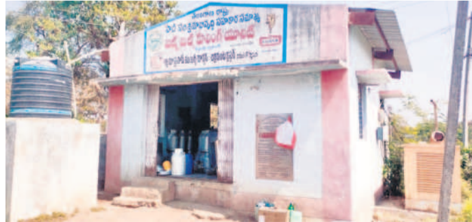
ఆసిఫాబాద్ జిల్లా కేంద్రంలోని బర్ని మిల్కు కాలింగ్ యూనిట్ కేంద్రం

రీతు వెన్న శాశాన్ని బట్టి రూ.40 నుంచి రూ.80 వరకు ధర నిర్ణయిస్తారు. 30 రోజులు గడిచినా.. పాడి పరిశ్రమను ప్రోత్సహించేందుకు కేసీఆర్ సర్కారు అనేక చర్యలు చేపట్టింది. విజయ దెయిరీ సహకారంతో పాడి రైతుల నుంచి పాలు సేకరించి, వారిని ఆర్థికంగా ముందుకు తీసుకోవేందుకు ప్రత్యేక కార్యక్రమం చేపట్టింది. ఇందులో భాగంగా పక్షం రోజులకోసారి పాల డబ్బులను నేరుగా వారి ఖాతాల్లో జమ చేసే వారు. కానీ, ప్రస్తుతం 30 రోజులు గడిచినా మంచీర్యాల జిల్లా తాండూర్ మండలానికి చెందిన 480 మంది రైతుల నుంచి పాలను సేకరించి, ఇక్కడికి తరలిస్తారు. ప్యాక్కింగ్ కోసం రైల్వే వేదిక తరలిస్తారు. రైతులకు లీట