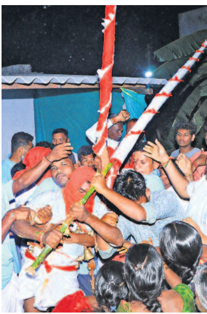
మేడారంలో మంగళవారం కనెక్టివ్ నుంచి జంపనను తీసుకొస్తున్న పూజారులు