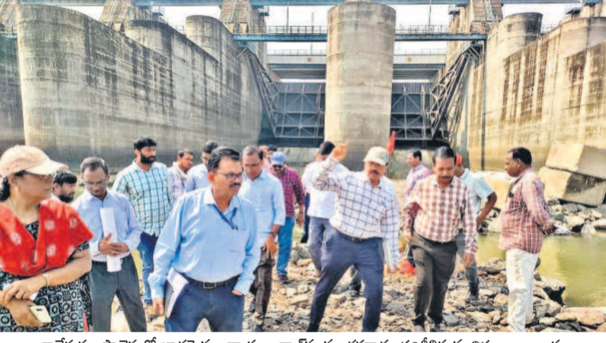
కాశీబరం ప్రాజెక్టులో భాగమైన అన్నారం బరాజ్ ను మంగళవారం పరిశీలిస్తున్న నిపుణుల బృందం

బయ్యోట్ల 39 కి.మీ.పొడవును తిన్నట్లై రోడ్డు విలేజీ కోహినూర్ కేంద్రంగా 3 మార్గాలు జీవీకేమార్ల నుంచి నానల్ నగర్ వరకు > 2 నాంపల్లి నుంచి చాంద్రావారిగుట్ట వరకు ఈవోబి బండరు పిలిచిన జీహెచ్ఎస్