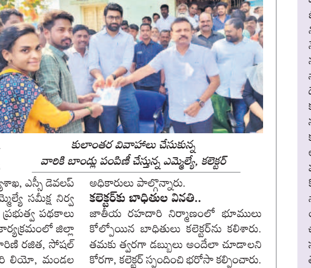
కులాంతర వివాహాలు చేసుకున్న వారికి బాంధ్యం పంచుకోవడం చేస్తున్న ఎమ్మెల్యే, కలెక్టర్

అధిష్టానం సీరియస్.. అర్వింద్ వ్యవహార శైలిపై గతంలోనే డిజి పెద్దలు తీవ్ర స్థాయిలో మండిపడినట్లు పార్టీ వర్గాలు చెబుతున్నాయి. ఆయనపట్టికి తీరు మారుకోకపోతే సొంత పార్టీ నేతలను