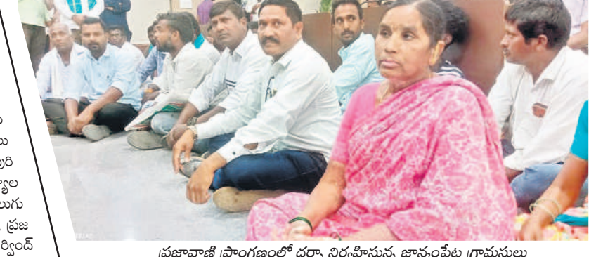
ప్రజావాణి ప్రాంగణంలో ధర్మా నిర్వహిస్తున్న జాన్యంపేట గ్రామస్థులు

ప్రజావాణి ప్రాంగణంలో ధర్మా భద్రతా వైఫల్యంతో పెద్ద సంఖ్యలో జనం స్తంభించిన దరఖాస్తుల స్వీకరణ