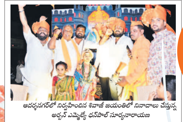
ఆదర్శనగర్లో నిర్వహించిన శివాజీ జయంతిలో నివాదాలు చేస్తున్న ఆర్ఎస్ ఎమ్మెల్యే ధనవంత్ సూర్యనారాయణ

5 నిజామాబాద్, మంగళవారం 20 ఫిబ్రవరి 2024 NIZAMABAD