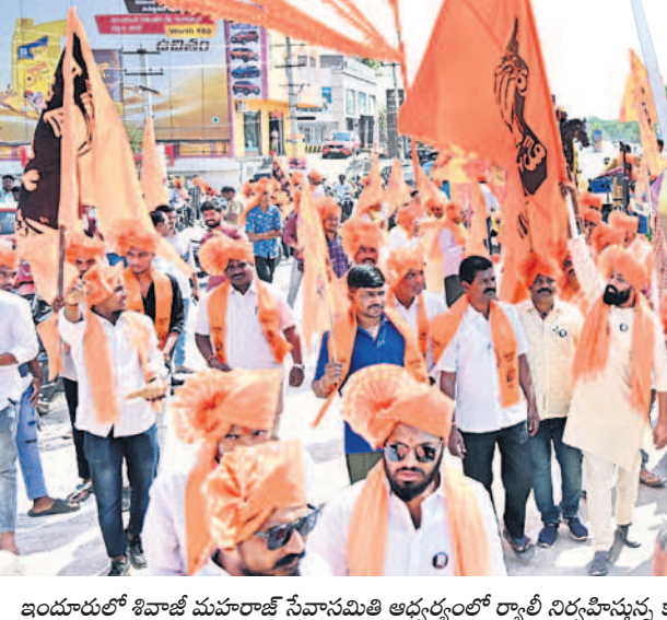
ఇందూరులో శివాజీ మహారాజ్ సేవాసమితి ఆధ్వర్యంలో ర్యాలీ నిర్వహిస్తున్న కార్యకర్తలు

ఉమ్మడి జిల్లాలో సోమవారం చిత్రపతి శివాజీ మహారాజ్ జయంతి వేడుకలు మనంగా నిర్వహించారు. ఊరూరా ర్యాలీలు నిర్వహించి, శివాజీ విగ్రహాలను, విగ్రహటాలకు పూలమాలలు వేసి నివాళులు అర్పించారు. పలుచోట్ల శివాజీ విగ్రహాలను స్థానిక ప్రజాప్రతినిధులు ఆవిష్కరించారు. ఈ సందర్భంగా చిత్రపతి శివాజీ మహారాజ్ ఆదర్శవంతుడైన పాలకుడని కొనియాడారు.