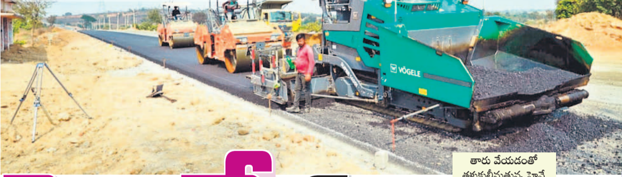
తారు వేయడంతో తరుకుతున్న మహబూబ్ నగర్