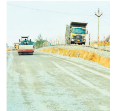
నాగర్ కర్నూల్ జిల్లాలో సాగుతున్న రోడ్డు పనులు వాహనదారులకు దాదాపు రెండు గంటల ప్రయాణ సమయం తగ్గుతుంది.

ప్రస్తుతం జరుగుతున్న హైవే పనుల్లో ఇప్పటికే నాగర్ కర్నూల్ నుంచి కొల్వూర్, కల్వకుల్లికి వెళ్లే ప్రయాణ సమయం దాదాపుగా 15 నిమిషాల వరకు తగ్గింది. రోడ్డు పనులన్నీ పూర్తయితే హైదరాబాద్-తిరుపతి మధ్య దాదాపుగా 80 కిలోమీటర్ల దూరం తగ్గునున్నది. ప్రస్తుతం తిరుపతితో పాటుగా చెన్నై, ఇతర ఏపీలోని సీమ ప్రాంతాలకు వెళ్లాలంటే జడ్చర్ల మీదుగా ఉన్న జాతీయ రహదారి (హైవే-44) మీదుగా వెళ్లి, దీంతో ఒకటి మార్గం ఉండడంతో రోడ్డుపై వాహనాల రద్దీ బాగా పెరిగింది. దీని వల్ల రోడ్డు ప్రయాణాలు వాహనదారులకు భారంగా మారాయి. కల్వకుల్లి-నంద్యాల పనులు పూర్తయితే ప్రయాణికులకు దూరభారంతో పాటుగా ఆర్థికంగా గానూ కలిపి వస్తుంది. ఈ రోడ్డుపై గరిష్ట వేగం వంద కిలోమీటర్లుగా నిర్ణయించనున్నారు. ఫలితంగా