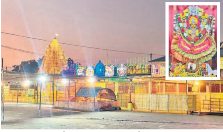
గద్వాల సమీపంలోని జములమ్మ ఆలయం, ఇన్సెన్ట్లో (జములమ్మ మూలవిరాళి)