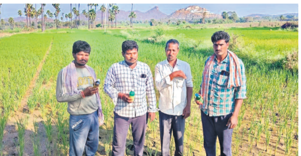
మిడ్ మానేరు కుడికాలువ చివరి అయకట్టు పొలాలు నీరందక ఎండిపోతున్నాయి. దీంతో కర్రంనగర్ జిల్లా సైదాపూర్ మండలం గుజ్జలపల్లి రైతులు పురుగుమందు డబ్బాలతో నిరసనకు దిగారు. నీళ్లవ్వకపోతే అత్తహత్యే శరణ్యమని ఆవేదన వ్యక్తంచేశారు.