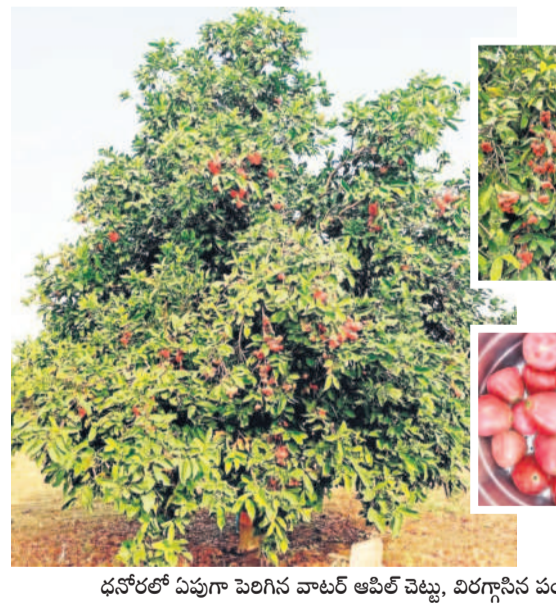
ధనోల్లో ఏపూగా పెరిగిన వాలర్ ఆపిల్ చెట్టు, విరగ్గసిన పండ్లు

మరో కొత్త పంటకు శ్రీకారం చుట్టిన కేంద్ర బాలాజీ