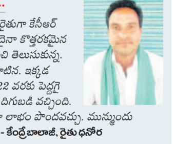
కేంద్ర బాలాజీ, రైతు ధనోల్

ధనోల్లో యాపిల్ సాగు చేసిన, రాష్ట్ర ఉత్తమ రైతుగా కేసీఆర్ చేతుల మీదుగా అవార్డు అందుకున్న, మళ్లీ ఏదైనా కొత్తరకమైన పంట వేయాలనుకున్న వాలర్ యాపిల్ గురించి తెలుసుకున్న. 2015లో కేరళ వెళ్లి నాలుగు మొక్కలు తెచ్చి నాటిన. ఇక్కడ మొక్కలు పెరుగుతాయో లేవో అనుకున్న. 2022 వరకు పెద్దగా నయం. కాయలు పడ్డాయి. ఇప్పటికే రెండుసార్లు దిగుబడి వచ్చింది. ఇది మూడోసారి. రూపాయి పెట్టుబడి లేకుండా లాభం పొందవచ్చు. మున్ముందు మరిన్ని చెట్లు పెట్టాలనుకుంటున్న.