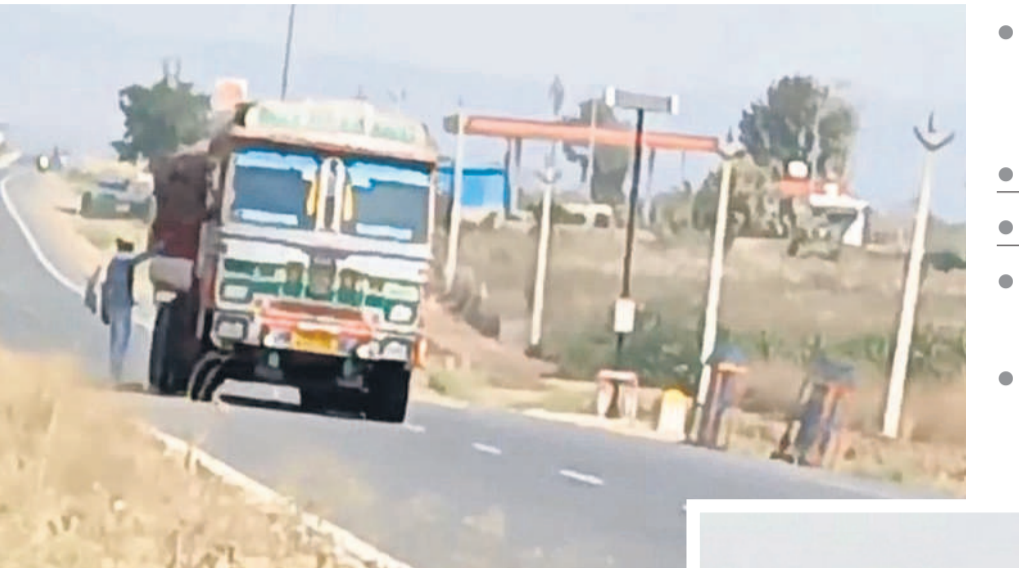
వాంకిడిలోని తెలంగాణ - మహారాష్ట్ర సరిహద్దులో ఎక్స్ ప్రెస్ చెక్ పోస్టు వద్ద వాహనాలనుంచి దణ్ణు వసూలు చేస్తున్న ప్రైవేట్ వ్యక్తి

దండేపల్లి, ఫిబ్రవరి 18 : గూడెం శ్రీసత్య నారాయణస్వామి అలయంలో ఆదివారం స్వామివారి బ్రహ్మోత్సవాలు అట్టహాసంగా ప్రారంభమయ్యాయి. చాదాక్ష వైష్ణవ సంప్రదాయం ప్రకారం ఈ ఉత్సవాలు ఈనెల 25 వరకు కొనసాగునున్నాయి. బ్రహ్మోత్సవాల ప్రారంభంలో భాగంగా డేవతా మూర్తుల విశ్రాంతికి గుట్టపై ఉన్న సప్తాహ భజన మండపం వరకు సన్నాయి వాయిద్యాలతో తీసుకెళ్లి ప్రత్యేక పూజలు నిర్వహించారు. నిత్యవిధి, ప్రాథోధిక ఆరగింపు, తీర్థ ప్రసాద గోష్టి, విశ్వేశ్వరనాదాదన, దీక్షాకంఠాధారణ