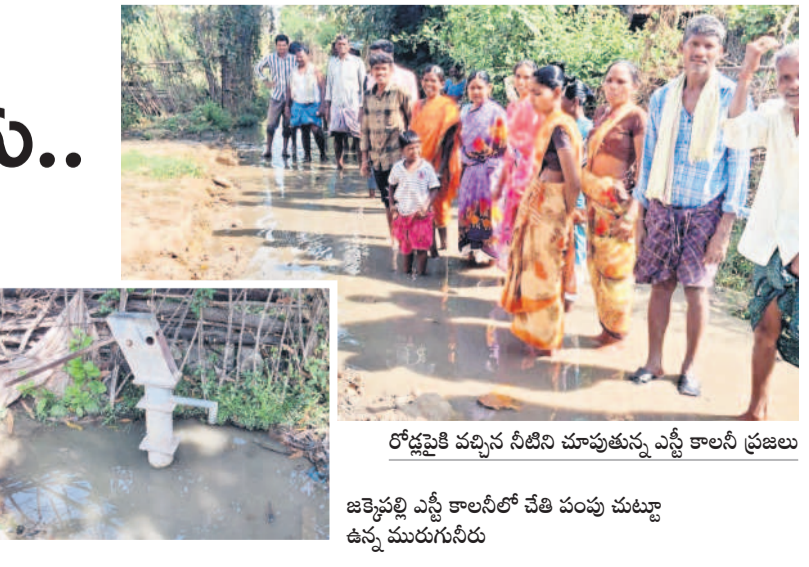
రోడ్డుపైకి వచ్చిన నీటిని చూపుతున్న ఎన్టీ కాలనీ ప్రజలు

వేమనపల్లి, ఫిబ్రవరి 18 : చేతి పంపు ఉన్న ప్రాంతంలో మురుగు నీరు చేరి స్థానిక ప్రజలు ఇబ్బంది పడుతున్నారు. మండలంలోని జక్కెపల్లి గ్రామంలోని ఎన్టీ వాడలో ఉన్న చేతి పంపు చుట్టూ మురుగు నీరు చేరింది. దీంతో తాగునీటిని తీసుకోవడం ఇబ్బందులు ఎదురవుతున్నాయి. చేతి పంపు పక్కన ఎలాంటి డ్రైనేజీ లేకపోవడంతో నీరంతా రోడ్డుపైకి చేరి ఇండ్ల ముందు చేరడంతో ప్రజలు ఇబ్బం