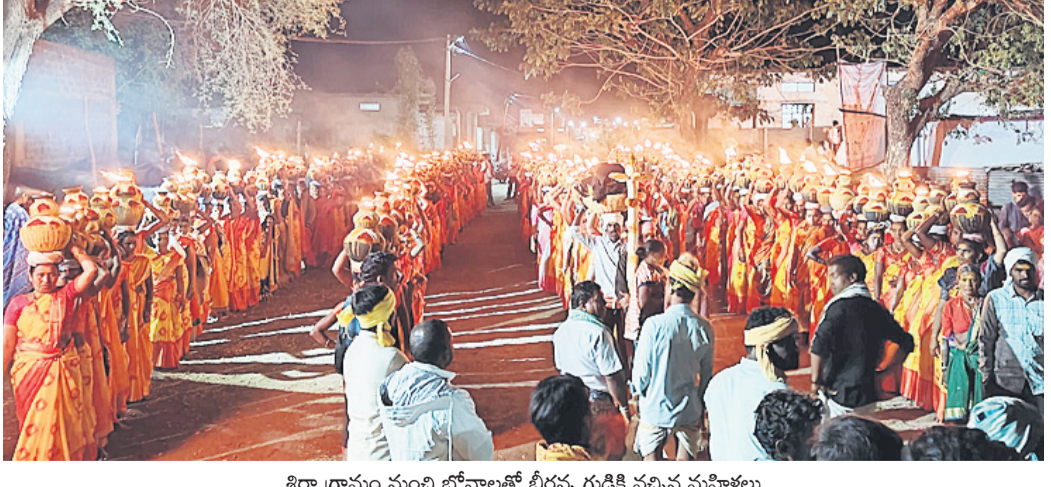
శిర్డీ గ్రామం నుంచి బోనాలతో బీరన్న గుడికి వచ్చిన మహిళలు