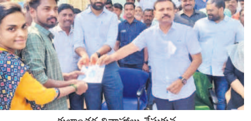
కులాంతర వివాహాలు చేసుకున్న వారికి బాంధ్యం పంచుకోవడం చేస్తున్న ఎమ్మెల్యే, కలెక్టర్

నిజాంపుగర్స్ పునరుద్ధరణ కమిటీ రాక వాయిదా పడింది.