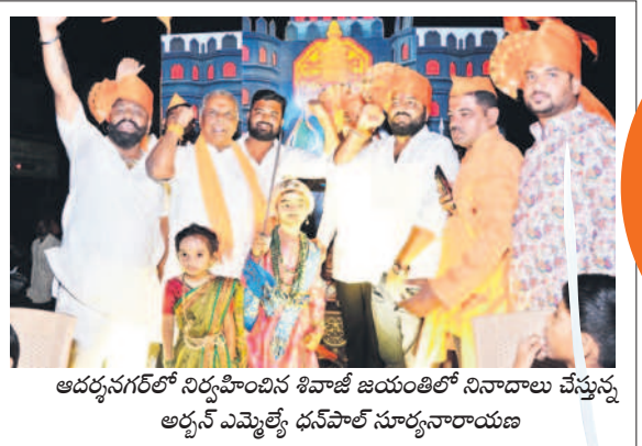
ఆదర్శనగర్లో నిర్వహించిన శివాజీ జయంతిలో నినాదాలు చేస్తున్న ఆదర్శ ఎమ్మెల్యే ధనవల్ సూర్యనారాయణ

5 నిజామాబాద్, మంగళవారం 20 ఫిబ్రవరి 2024 KAMAREDDY