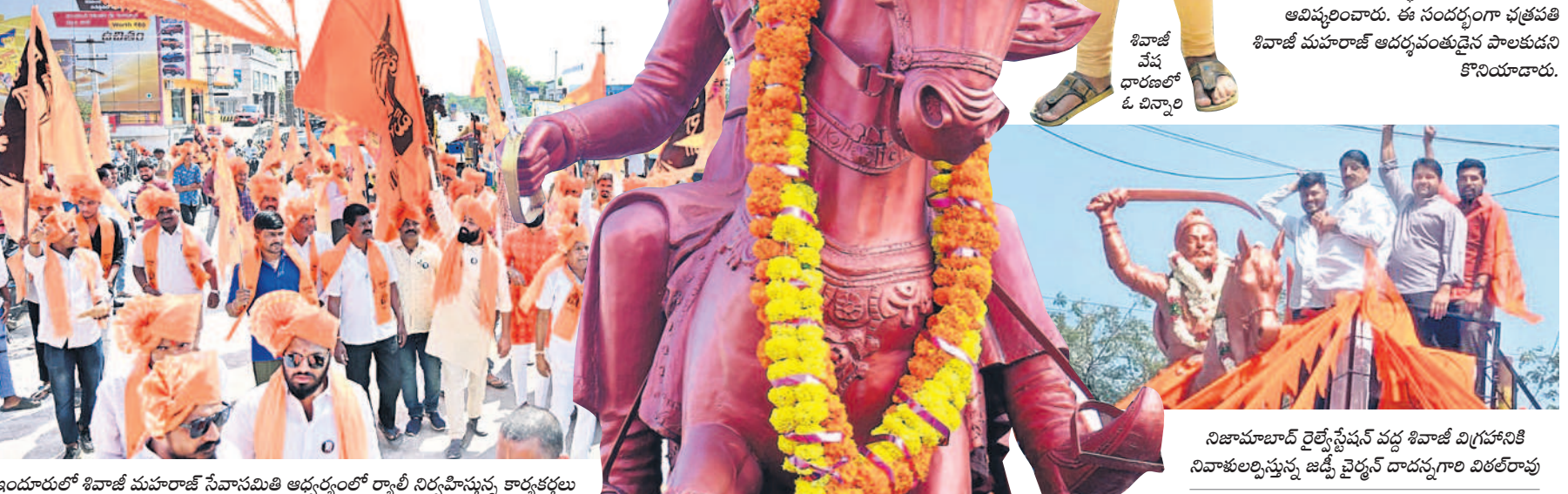
జందూరులో శివాజీ మహారాజ్ సేవాసమితి ఆధ్వర్యంలో ర్యాలీ నిర్వహిస్తున్న కార్యకర్తలు

ఉమ్మడి జిల్లాలో సోమవారం చిత్రపతి శివాజీ మహారాజ్ జయంతి వేడుకలు మనంగా నిర్వహించారు. ఊరూరా ర్యాలీలు నిర్వహించి, శివాజీ విగ్రహాలను, విగ్రహాలకు పూలమాలలు వేసి నివాళులు అర్పించారు. పలుచోట్ల శివాజీ విగ్రహాలను స్థానిక ప్రజాప్రతినిధులు ఆవిష్కరించారు. ఈ సందర్భంగా చిత్రపతి శివాజీ మహారాజ్ ఆదర్శవంతుడైన పాలకుడని కొనియాడారు.