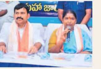
మాట్లాడుతున్న మంత్రి సీతక్క, చిత్రంలో మంత్రి పొంగులేటి, కలెక్టర్ ఇలా త్రిపాఠి

హించి, మొక్కులు చెల్లించుకున్నారు. అనంతరం గద్దెల ప్రాంగణంలో మీడియాతో మంత్రులు మాట్లాడారు. జాతరను అంగీకరించిన మనదేవతల సమృద్ధి, సారలమ్మ దర్శనం మంత్రులు చెప్పారు. మహాజాతరలో భాగంగా అమ్మవార్లను దర్శించుకునేందుకు 2 కోట్ల మంది భక్తులు తరలివస్తారనే అంచనాలు ఉన్నాయని, అందుకు తగ్గట్టుగానే భక్తులకు అసౌకర్యం కలగకుండా ఏర్పాట్లు చేపట్టామని తెలిపారు. వీవీవీల తమ వాహనాల్లో ములుగు వరకు వచ్చి అక్కడే పార్కింగ్ చేసి