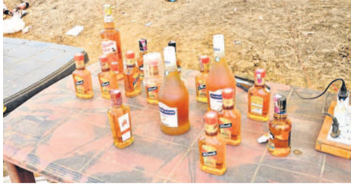
మేడారంలో విక్రయిస్తున్న మద్యం

ములుగు, ఫిబ్రవరి 19 (నమస్తే తెలంగాణ): మేడారం మహా జాతరలో మద్యం దందా మాడు పుట్టులు ఆరు కాయలుగా కొనసాగుతున్నది. తల్లల దర్శనానికి వచ్చే భక్తులకు మద్యం అంటగట్టేందుకు ఎక్సైజ్ శాఖ అమ్మకాలకు టార్గెట్ పెట్టేసింది. కడ్డంపడి గుడ్డి వారి వలె విధులు, నిబంధనలను గాలికొదిలి అధిక రేట్లకు మద్యాన్ని విక్రయించే వ్యాపారులతో అధికారులు అంటకొనుతున్నారు. సుదూర ప్రాంతాల నుంచి వచ్చిన భక్తులు అమ్మవారికి తనివితీరా మొక్కులు చెల్లించిన అనంతరం పరిసర ప్రాంతాల్లో చుక్క, ముక్కకు ఎక్కువ ప్రాధాన్యం ఇస్తూ కంటికి దూరం అవుతున్నట్లు అమ్మవారు భక్తులను నిలుపుతూ డోపిడిపాటున్నారు. వ్యాపారులు ఇచ్చే మామూళ్ల మత్తులో తేలాడుతూ ఎక్సైజ్ అధికారులు విధులను మమ అనిమిస్తున్నారు. దీనికి తోడు కల్లీ మద్యాన్ని సైతం భక్తులకు అందిగడుతున్నారు. స్పెషల్ కలిపిన కుంటున్నారు. ఈ కల్లీ మద్యం వాగిన ఎండలో అనారోగ్యం బారిన పడుతున్నారు.