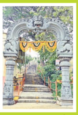
ఖిల్లా రామాలయ స్వాగత తోరణం