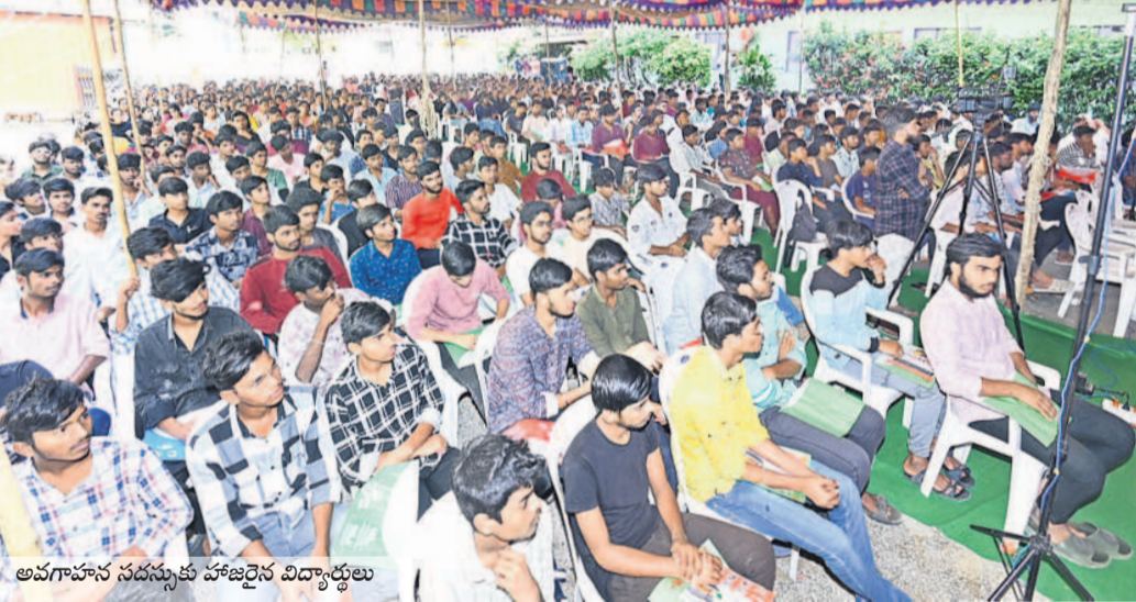
అవగాహన సదస్సుకు హాజరైన విద్యార్థులు