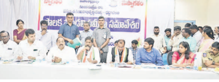
భద్రాచలం ఐటీడీపీ పాలక మండలి సమావేశంలో మాట్లాడుతున్న డిప్యూటీ సీఎం మల్లు భట్టి విక్రమార్క చిత్రంలో మంత్రులు తుమ్మల నాగేశ్వరరావు, కొమటిరెడ్డి వెంకటరెడ్డి