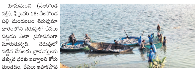
చేపల వేటలో మత్స్యకారులు

కూసుమంచి (నేలకొండ పల్లి), ఫిబ్రవరి 18: నేలకొండ పల్లి మండలం చెరువు మాధారంలోని చెరువులో చేపల పట్టడం ఏడా ప్రచారానికి మారుతున్నది. చెరువులో పట్టిన చేపలను గ్రామస్థులకు తక్కువ ధరకు ఇవ్వాలని కోరుతుండడం, చేపల ఇవ్వకపోవడంతో గ్రామస్థులు ఆగ్రహించి అమాంతం చేపలను ఎత్తుకోవడం వంటి అనేక పనులు కోటు చేసుకుంటున్నారు. పోలీస్ ఛార్జి ఉంటే తప్ప గ్రామస్థులు నిలువరించే పరిస్థితి లేకపోయింది. ఈసారి కూడా " ఒక అడుగు ముందు పడితే నాలుగు అడుగులు వెనక్కి..." అన్నట్లు చేపల వేట జరుగుతున్నది. శుభ్ర శని వారాల్లో మత్స్యకారులు చేపల పట్టేందుకు యత్నించగా గ్రామస్థులు అక్కడకి వచ్చి వేటను అడ్డుకున్నారు. గ్రామస్థులకు తక్కువ ధరలో చేపల ఇచ్చే విషయంలో మత్స్యకారులు, కంట్రాక్టర్ల మధ్య విభేదాలు రావడంతోనే ఈ పరిస్థితి. కాంట్రాక్టర్ల ఆదివారం తెల్లవారుజామున ఏకంగా పెద్ద కేసీను చెరువు వద్దకు తీసుకొచ్చారు. మత్స్యకారులు తెల్లొచ్చి సాయం చేపలను పట్టగానే కేసీని సాయంతో చేపలను సరసరి కంటెయిన్లలోకి వేసి విధంగా ఏర్పాటు చేశారు. గ్రామస్థులు దీంతో ఆగ్రహానికి గురై చేపల వేటను అడ్డుకునేందుకు యత్నించారు. ఒక శత్రో ఉద్ధృత పర్యట్ చేరుతున్న పరిసర ప్రాంతమంతా బురదమయమైంది. బురదలో ఒక మూడు రోజుల్లో సుమారు 5 టన్నుల చేపలు మృతిచెంది విక్రయానికి పనికిరాకుండా పోయాయి. ఏదేమైనా సోమవారం తెల్లవారుజాము నుంచి తిరిగి చేపల వేట కొనసాగిస్తున్న మత్స్యకారులు తెలిపారు.