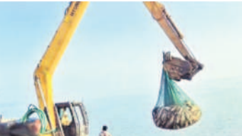
కంట్రైన్లలోకి చేపల వేస్తున్న కేసీ

కూసుమంచి (నేలకొండ పల్లి), ఫిబ్రవరి 18: నేలకొండ పల్లి మండలం చెరువు మాధారంలోని చెరువులో చేపల పట్టడం ఏడా ప్రచారానికి మారుతున్నది. చెరువులో పట్టిన చేపలను గ్రామస్థులకు తక్కువ ధరకు ఇవ్వాలని కోరుతుండడం, చేపల ఇవ్వకపోవడంతో గ్రామస్థులు ఆగ్రహించి అమాంతం చేపలను ఎత్తుకోవడం వంటి అనేక పనులు కోటు చేసుకుంటున్నారు. పోలీస్ ఛార్జి ఉంటే తప్ప గ్రామస్థులు నిలువరించే పరిస్థితి లేకపోయింది. ఈసారి కూడా " ఒక అడుగు ముందు పడితే నాలుగు అడుగులు వెనక్కి..." అన్నట్లు చేపల వేట జరుగుతున్నది. శుభ్ర శని వారాల్లో మత్స్యకారులు చేపల పట్టేందుకు యత్నించగా గ్రామస్థులు అక్కడకి వచ్చి వేటను అడ్డుకున్నారు. గ్రామస్థులకు తక్కువ ధరలో చేపల ఇచ్చే విషయంలో మత్స్యకారులు, కంట్రాక్టర్ల మధ్య విభేదాలు రావడంతోనే ఈ పరిస్థితి. కాంట్రాక్టర్ల ఆదివారం తెల్లవారుజామున ఏకంగా పెద్ద కేసీను చెరువు వద్దకు తీసుకొచ్చారు. మత్స్యకారులు తెల్లొచ్చి సాయం చేపలను పట్టగానే కేసీని సాయంతో చేపలను సరసరి కంటెయిన్లలోకి వేసి విధంగా ఏర్పాటు చేశారు. గ్రామస్థులు దీంతో ఆగ్రహానికి గురై చేపల వేటను అడ్డుకునేందుకు యత్నించారు. ఒక శత్రో ఉద్ధృత పర్యట్ చేరుతున్న పరిసర ప్రాంతమంతా బురదమయమైంది. బురదలో ఒక మూడు రోజుల్లో సుమారు 5 టన్నుల చేపలు మృతిచెంది విక్రయానికి పనికిరాకుండా పోయాయి. ఏదేమైనా సోమవారం తెల్లవారుజాము నుంచి తిరిగి చేపల వేట కొనసాగిస్తున్న మత్స్యకారులు తెలిపారు.