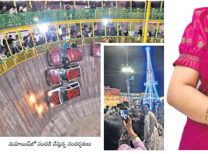
సుమాయిష్లో సందడి చేస్తున్న సందర్భాలు