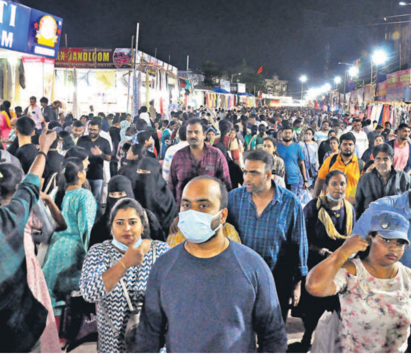
చివరి రోజు సుమాయిష్ భారతిగా తరలివచ్చిన సందర్భాలు

గ్రేటర్లో 9 సర్కిళ్లు.. గ్రేటర్ హైదరాబాద్ పరిధిలో నిరంతర నాణ్యమైన విద్యుత్ సరఫరాను అందించేందుకు మొత్తం 9 సర్కిళ్లు, వాటి పరిధిలో డివిజన్లు, సబ్ డివిజన్లు, సెక్షన్ కార్యాలయాలు ఏర్పాటు చేశారు. ప్రతి సెక్షన్ పరిధిలో క్షేత్ర స్థాయిలో లైన్ ఇన్స్పెక్షన్తో పాటు లైన్ మెయిన్లు, వారికి సహాయకులు హెల్పర్లు (ఆర్టియోగదారులు సెక్షన్ కార్యాలయానికి ఫోన్ చేస్తే విద్యుత్లో ఉంటున్నా.. విద్యుత్ అంతరాయం ఏమయితే తలెత్తున్న సమస్యలపై అధికారులు చెబుతున్నారు. సమస్యను ఎవరైతే బృందాలు లకు చెబితే తాము వేరే ఫిర్యాదు వస్తే దాన్ని సరిచేసి వస్తామని, సమయం పడుతుంటే పూర్తిగా ఫోన్ పెట్టే సూచనలు ప్రతి పరిధిలో ఉండే లైన్ ఇన్స్పెక్షన్ క్రమం, లైన్ మెయిన్లు, వారికి సహాయకులు ఉండే హెల్పర్లు విద్యుత్ ఉంటున్నా.. వారు మాత్రం సమస్యను పరిష్కరించేందుకు ముందుకు రావడం లేదని వినియోగదారులు ఆరోపిస్తున్నారు.