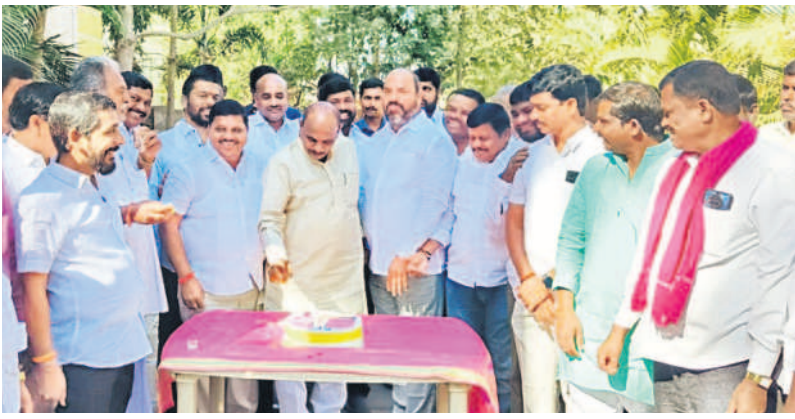
చేపల్లెటూరు: కేకే కట్టే చేస్తున్న ఎమ్మెల్యే కాలి యాదయ్య