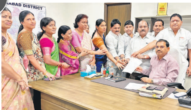
అదనపు కలెక్టర్కు నోటీసులు అందజేస్తున్న 12 మంది జడ్పీటీసీలు