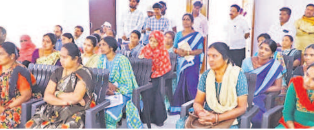
హాజరైన మహిళా సంఘాల సభ్యులు.